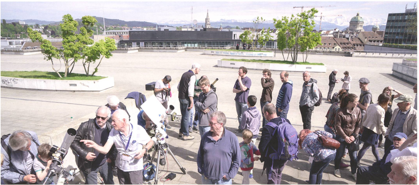
Abbildung 2: Dachterasse mit Bern im Hintergrund: Das ExWi ist ideal gelegen oberhalb des Bahnhofs. Mit dem Bundeshaus und dem Münster im Hintergrund sowie dem unverkennbaren Bergpanorama von Bern war das Warten kurzweilig.

wortlich ist. Wie bei Rosetta müssen wir uns aber nach dem Start noch in Geduld üben: Erste Bilder gibt es frühestens ab 2024. Besonders spannend wird das Ende der langen Reise. Ein schwieriges Bremsmanöver steht der Sonde be-