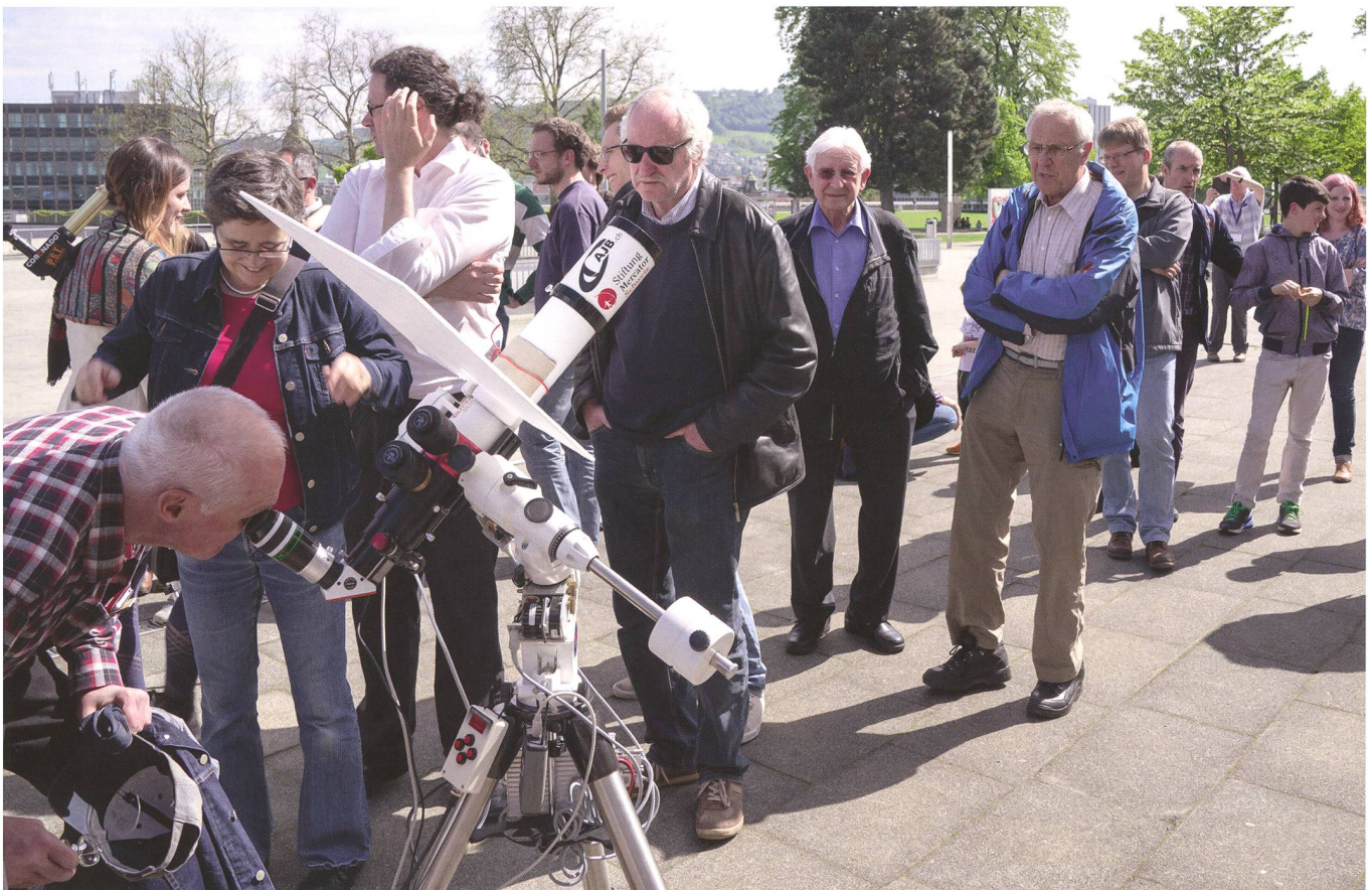
Abbildung 3: Das nagelneue Sonnenteleskop der Astronomischen Jugendgruppe im Einsatz zeigt mehr als nur den Merkur. Auch Filamente und Protuberanzen lassen sich sehen. Fotografieren lag nicht drin; die Schlange der Wartenden drängte zur Eile.

Astronomische Jugendgruppe Bern CH-3000 Bern www.ajb.ch