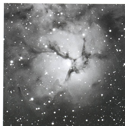
Trifid-Nebel (H V-10, 11, 12)