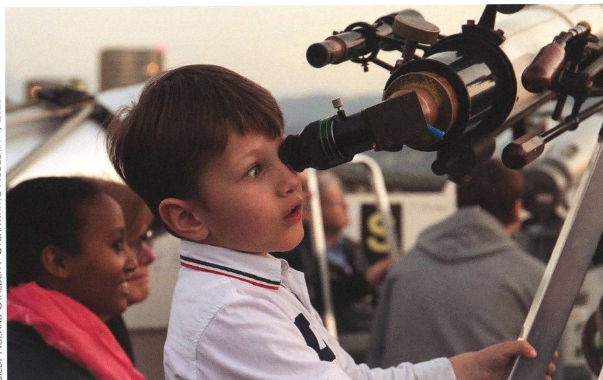
Abbildung 4: Dieser Junge hat den Merkur in der abendlichen Dämmerung erspäht.