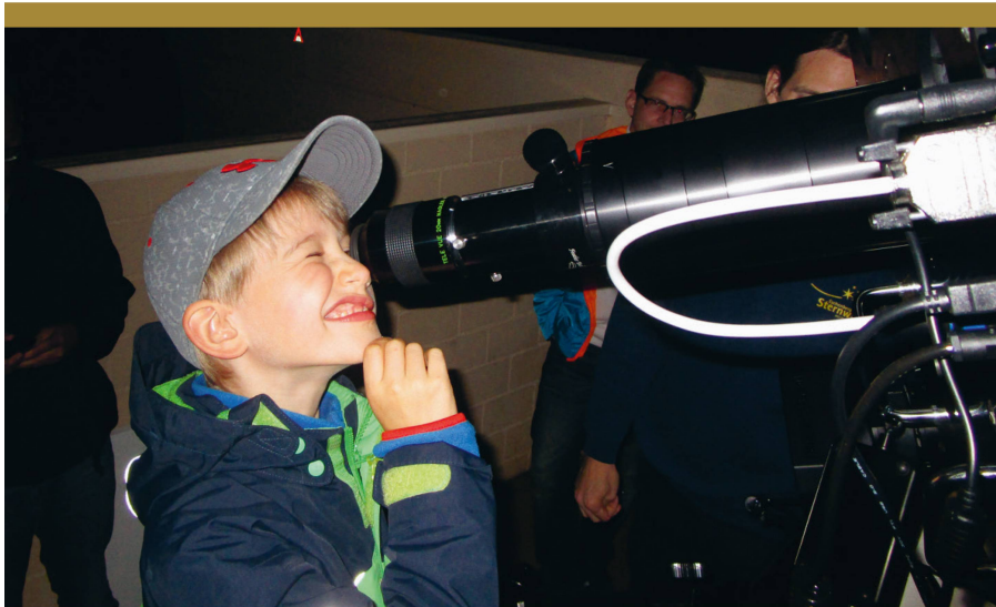
Abbildung 4: Kinder haben ganz besonderen Spass, Himmelsobjekte am Teleskop möglichst live zu erleben.