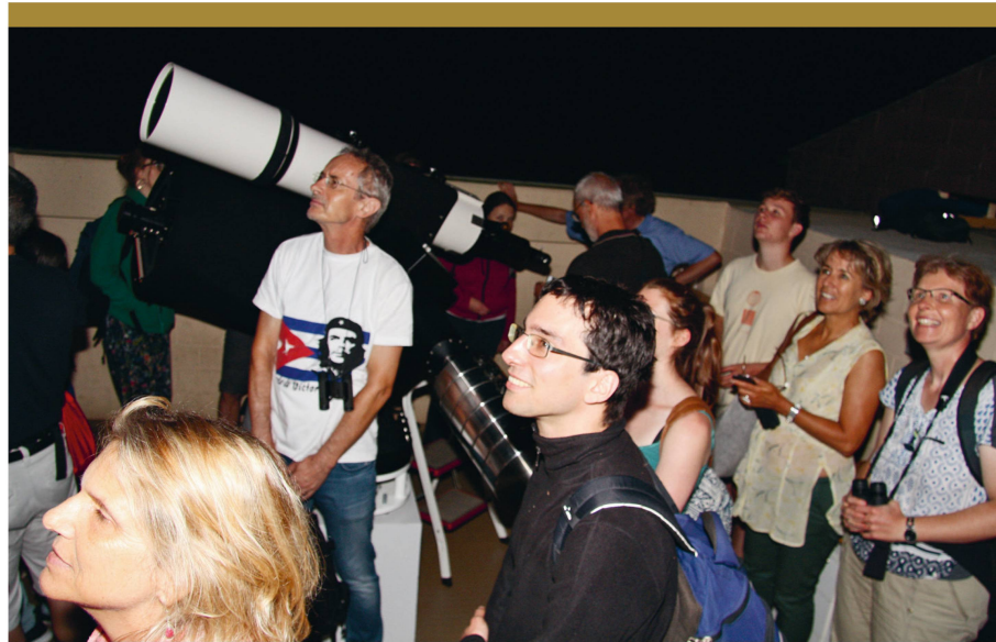
Abbildung 2: Alle blickten zum finsternen Mond. Die totale Mondfinsternis am 27. Juli 2018 lockte hunderte von Schaulustigen auf den Winterthurer Eschenberg. Trotz teils langer Wartezeit vor den Teleskopen sah man ausnahmslos zufriedene Gesichter.