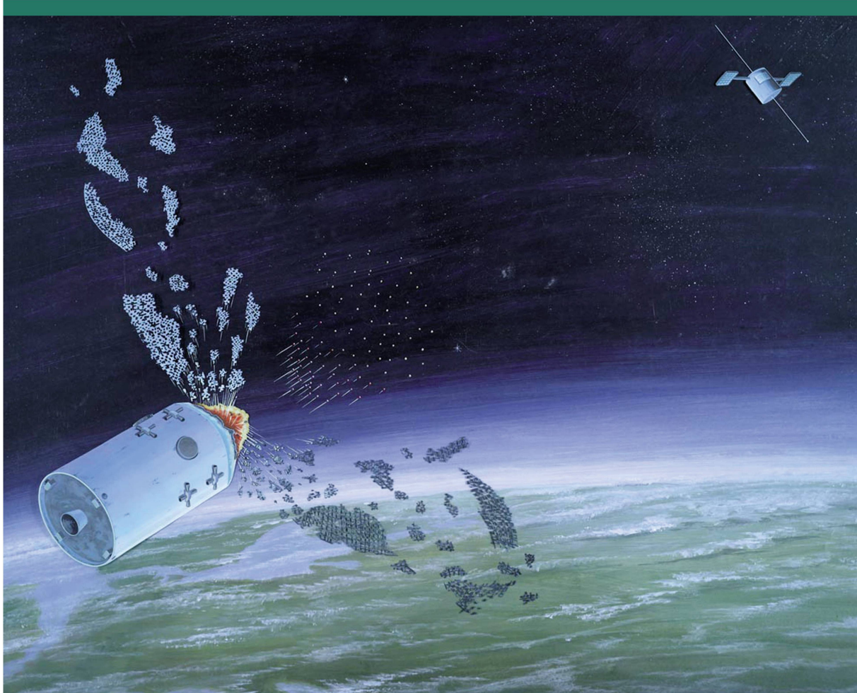
Abbildung 4: Abschuss eines feindlichen Kommunikationssatelliten.

«Es ist nicht genug, nur eine amerikanische Präsenz im Weltraum zu haben. Wir müssen amerikanische Dominanz im Weltraum haben. Und das werden wir.»