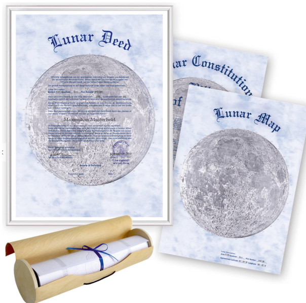
Abbildung 6: So sieht eine «Besitzurkunde» für ein Stück Land auf dem Mond aus.

politik, verbindliche Regeln für alle durchsetzbar sind, muss leider bezweifelt werden. Der Kampf um die unermesslichen Bodenschätze im Sonnensystem hat längst begonnen. Und wer nicht selbst daran teilnimmt, wird in Zukunft von anderen abhängig werden. Wenn jetzt sogar Länder wie Luxemburg eigene Spielregeln erlassen, der Bundesverband der Deutschen Industrie ein «schnelles Weltraum-Bergbau-Gesetz» fordert, so haben neue, klarer formulierte internationale Vertragswerke wohl kaum eine Chance auf Akzeptanz. Die Frage ist also weniger, ob Donald Trump eine Weltraumarmee aufbauen darf, sondern ob die Technik wirklich schon soweit ist, ob er dies also tun kann. – Lernt die Menschheit wirklich nie aus der Vergangenheit? <