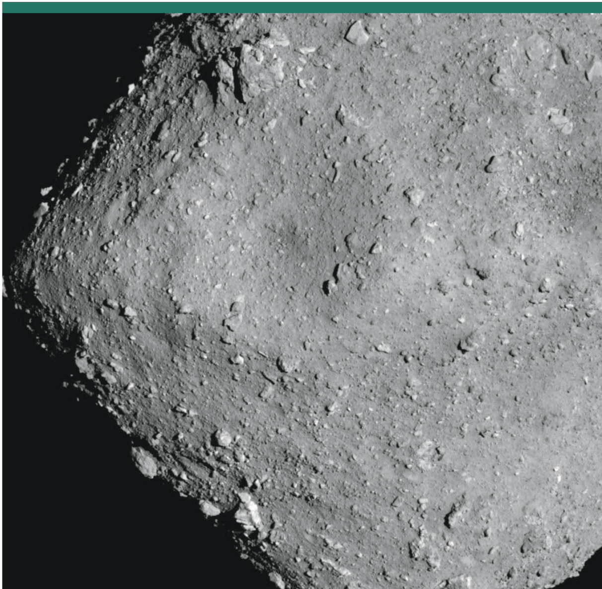
Abbildung 2: Asteroid Ryugu, aufgenommen von der japanischen Sonde Hayabusa-2, die am 3. Oktober 2018 den europäischen Lander Mascot erfolgreich auf der Oberfläche aufsetzen liess.

Längst sind die Satelliten im Erdorbit für uns zu einem alltäglichen Gebrauchsgegenstand geworden. Satelliten ermöglichen uns die Kommunikation über Kontinente hinweg, lassen uns fernsehen und leiten Flugzeuge über den Atlantik. GPS, Galileo und andere Systeme helfen uns bei der Suche nach dem nächsten Sushi-Restaurant, weisen uns bei Nebel den Weg zur rettenden Berghütte und helfen modernen Landwirten bei der optimalen Nutzung ihrer Agrarflächen. Ursprünglich ist das GPS-System für die militärische Navigation entwickelt worden, um Präzisionswaffen exakt ans Ziel zu lenken, Kriegsschiffe auf Kurs zu halten und strategische Bomber ins Zielgebiet zu steuern. Und jetzt stellen wir uns vor, ein Angreifer könnte als Erstschlag die Kommunikations- und Ortungssatelliten seines