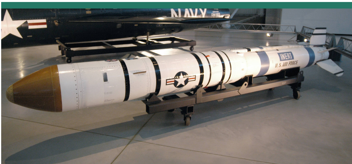
Abbildung 5: Vought Antisatelliten Waffe der US-Air- force aus den 1980 Jahren.

Was die Bewaffnung von Satelliten betrifft, so wird «nur» die Bestückung mit Massenvernichtungswaffen verboten, nicht aber jene mit irgendwelchen Sprengbomben. Weil nun gemäss Vertrag kein fremdes Eigentum im All beschädigt werden darf, dürfte ein