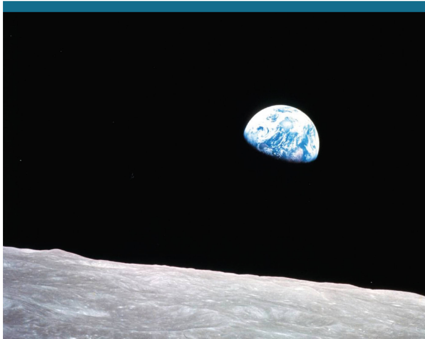
Abbildung 4: Die Erde geht über dem Mondhorizont auf. Diesen einmaligen Anblick hatte die Crew von Apollo 8.