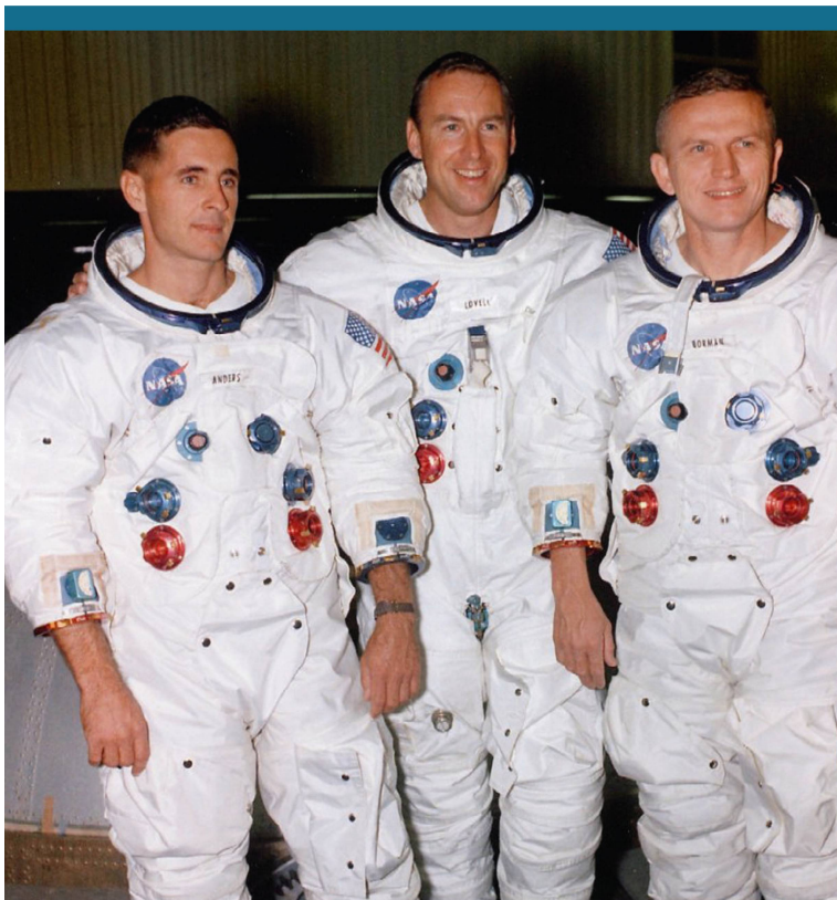
Abbildung 3: Die Crew von Apollo 8 mit William Anders , James Lovell und Frank Borman .