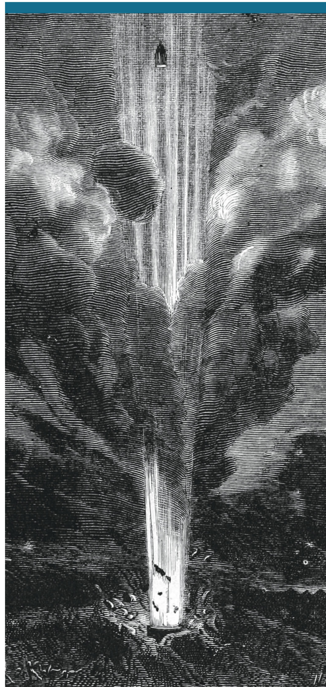
Abbildung 1: Eine Superkanone, geladen mit modernster Schiessbaumwolle, sollte die Kapsel auf den Mond schiessen.

Jules-Gabriel Verne , ältester Sohn eines Anwalts, interessierte sich schon als Student mehr für die Schriftstellerei und das Abenteuer als für sein Jurastudium. So mag es wenig erstaunen, dass sich der junge Schriftsteller Reiseabenteuer-Geschichten verschrieb.