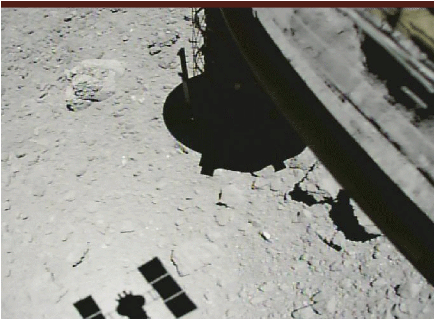
Abbildung 2: Ein Bild, das mit einer kleinen Überwachungskamera (CAM-H) bei der Landung 1 Probe 3 (TD 1 – R 3) aufgenommen wurde. Es wurde jede Sekunde kurz nach dem Beginn des Aufstiegs am 25. Oktober 2018 um 11:47 Uhr (japanische Zeit) in einer Höhe ca. 21 m fotografiert. Die Steiggeschwindigkeit beträgt etwa 52 cm/s.