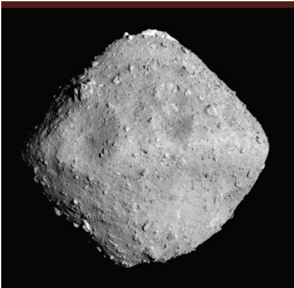
Abbildung 1: Asteroid Ryugu fotografiert am 26. Juni 2018.

«Als sich die Sonde im Frühsommer ihrem Ziel näherte, haben wir in Emails immer wieder über diese Frage spekuliert», erzählt Jutzi . Doch trotz intensiver Beobachtungen konnte die japanische Raumfahrtagentur