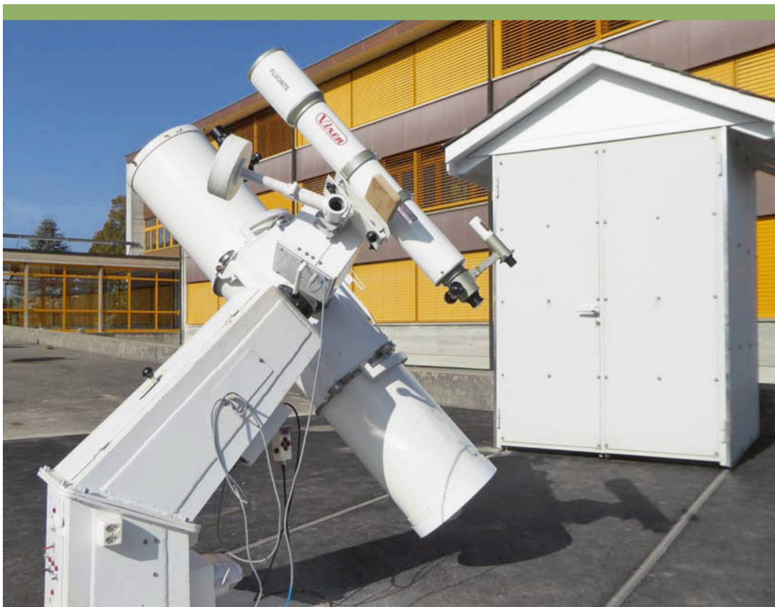
Abbildung 1: Schutzhaus und Instrumente auf dem Pausenplatz des Primarschulhauses.

In einer Sternwarte, die von grösseren Gruppen besucht wird, muss das Fernrohr leicht zugänglich sein. In der bestehenden Kuppel war das schlecht möglich, weshalb von Anfang an klar war, dass man ein neues Schutzhaus planen musste. Es war ebenfalls ein neuer Standort zu suchen. Dafür gab es bestimmte Bedingungen: Es durfte keine störenden Lampen in der Nähe haben, ein einigermaßen niedriger Horizont war Voraussetzung, Toiletten und ein Raum für Schlechtwetter-Programme sollten in der Nähe und der Ort vom Dorf aus leicht erreichbar sein. Mit dem damals gewählten Platz im Garten des Primarschulhauses an der Schlossgasse wurden diese Bedingungen recht gut erfüllt.