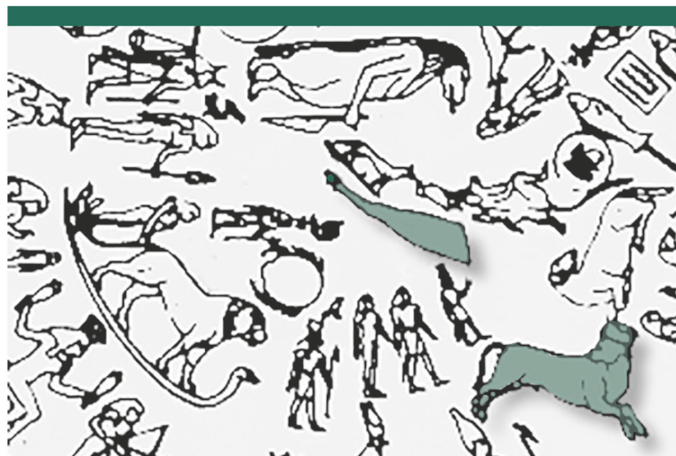
Abbildung 4: Darstellung von Stier und Stierschenkel auf dem runden Tierkreis von Dendera in Oberägypten (Zeichnung).