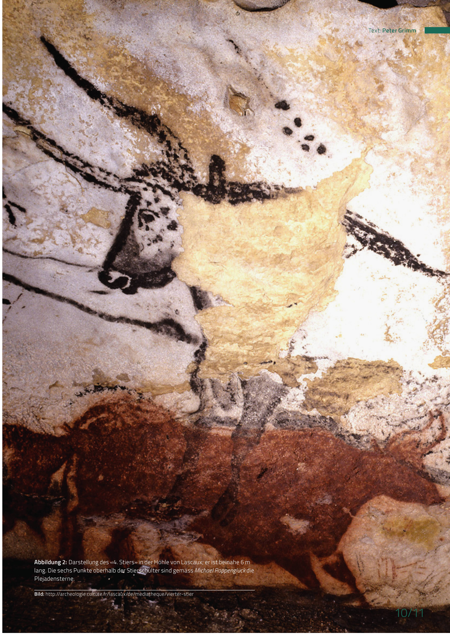
Abbildung 2: Darstellung des «4. Stiers» in der Höhle von Lascaux; er ist beinahe 6 m lang. Die sechs Punkte oberhalb der Stierschulter sind gemäss Michael Rappenglück die Plejadensterne.