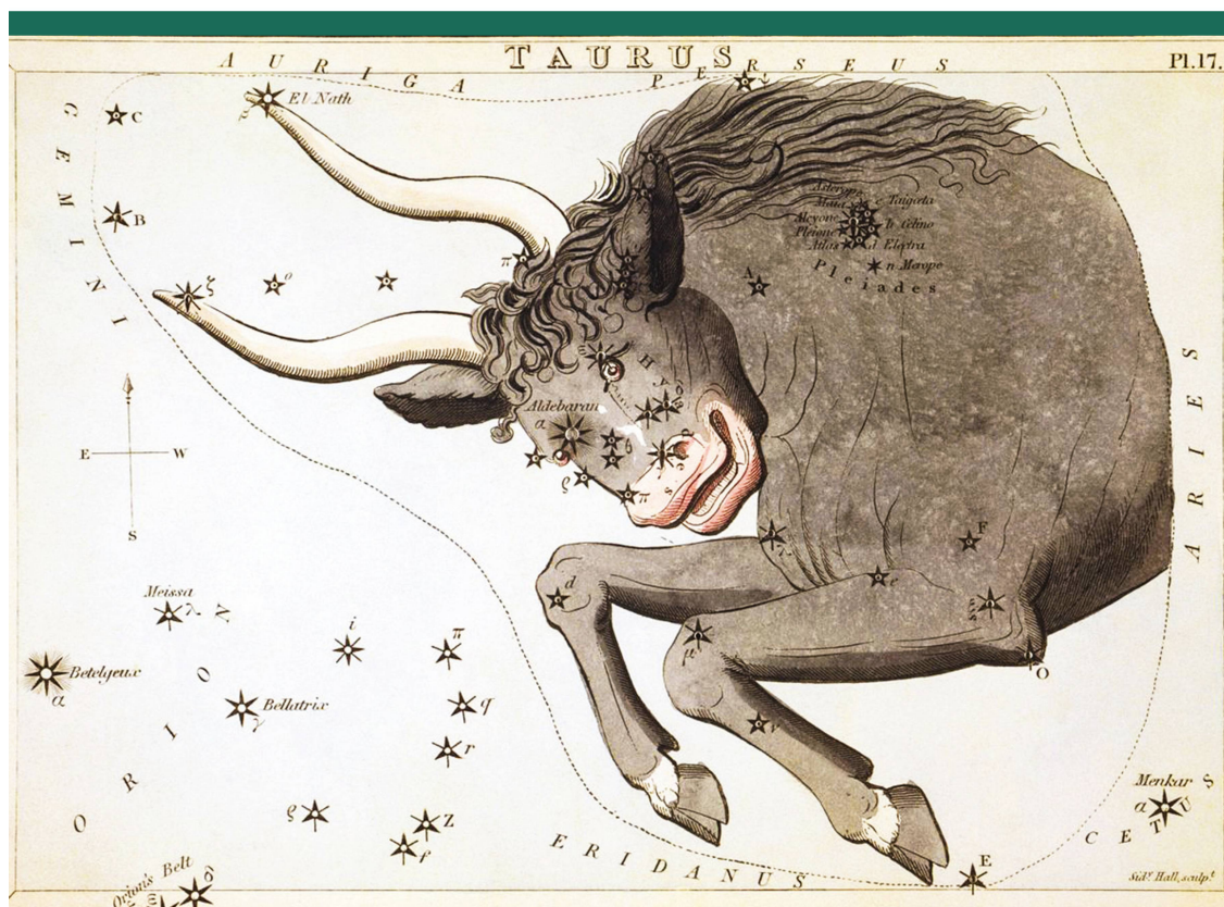
Abbildung 1: Sternbild Stier aus «Urania's Mirror» (1825) von Sidney Hall (1788 – 1831). Die Sammlungsbox enthielt 32 Sternbild-Karten. Sie waren bei den Sternen gelocht, sodass man sie vor eine Lichtquelle halten und das Sternen-Bild sehen konnte.

Die 1940 entdeckte Höhle von Lascaux in Südwest-Frankreich weist wundervolle jungsteinzeitliche Höhlenmalereien mit Tierdarstellungen auf. Heute zählt diese «Sixti-