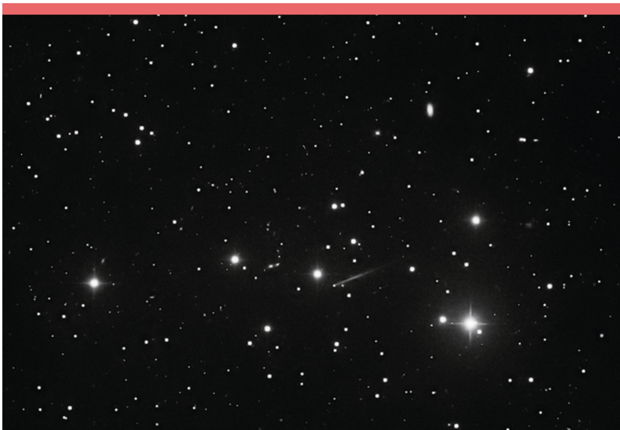
Abbildung 1: Diese Aufnahme von (6478) Gault wurde am 9. Januar 2019 mit dem 1 m-Schmidt-Teleskop der Optical Ground Station OGS der ESA auf Teneriffa (J04) aufgenommen. Es sind drei gestackte Einzelframes mit je 90 Sekunden Belichtungszeit.

Dass es auch bei längst bekannten Hauptgürtel-Asteroiden immer wieder zu Überraschungen kommen kann, wurde am 8. Januar 2019 durch eine ungewöhnliche Entdeckung manifestiert. Der US-amerikanische Survey ATLAS, der zur «Zwicky Transient Facility (ZTF)» gehört, meldete damals eine Aktivität des bisher ganz gewöhnlichen, schon seit vielen Jahren bekannten und völlig unauffälligen Asteroiden (6478) Gault.