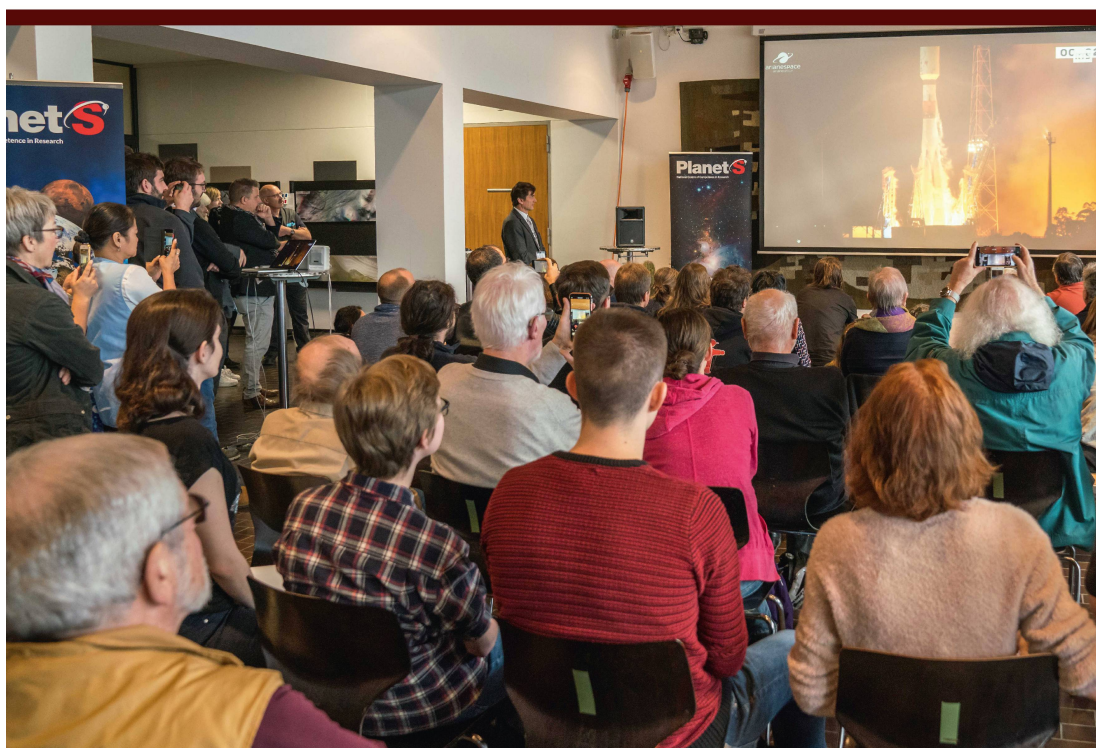
Abbildung 1: Die Zuschauer an der Universität Bern verfolgen den Start von CHEOPS mit Spannung.

Die frühe Orbit-Phase (LEOP) und die Inbetriebnahme im Orbit (IOC) werden von Airbus durchgeführt, bevor das Konsortium der CHEOPS-Mission die Verantwortung für den Betrieb des Weltraumteleskops übernimmt. Anfang Januar beginnt die CHEOPS-Crew mit der Inbetriebnahme des