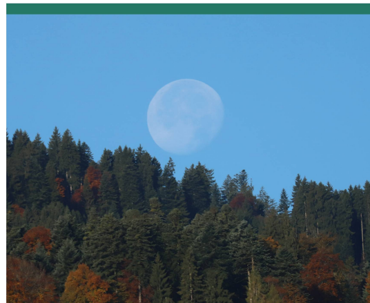
Abbildung 1: Der untergehende abnehmende Dreiviertelmond am Taghimmel.

Es ist in der Tat so, dass wir den zunehmenden Mond eher wahrnehmen als den abnehmenden, da wir weniger frühmorgens aufstehen, um einen Blick an den Sternenhimmel zu werfen. Nach dem Vollmondzeitpunkt verschiebt sich der Mondaufgang in die zweite Nachthälfte hinein. Je nach Steilheit der Ekliptik taucht der Mond täglich eine halbe bis eine Dreiviertelstunde später