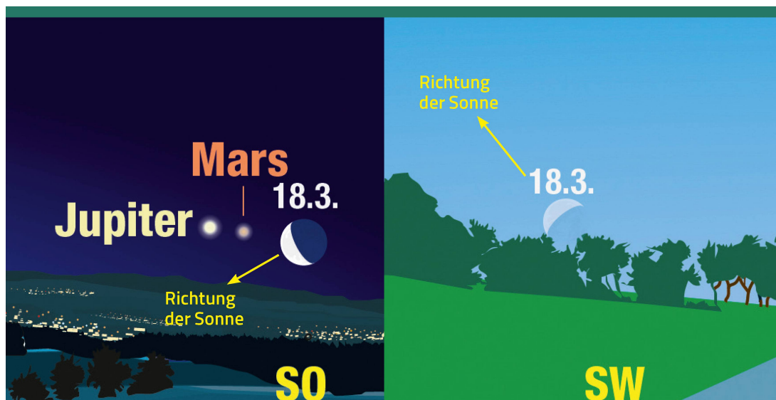
Abbildung 2: Mondauf- und Monduntergang am 18. März 2020. Man beachte die etwas ungewohnte Verkippung der Mondsichel zum Zeitpunkt ihres Untergangs.

entdecken können! Etwas ungewohnt mag uns beim Untergang der Mondsichel deren «Verkippung» sein. Diese kommt jedoch daher, dass die Sonne bei Mondaufgang gewissermassen «unter» dem Mond, bei Monduntergang jedoch «über» dem Mond steht. <