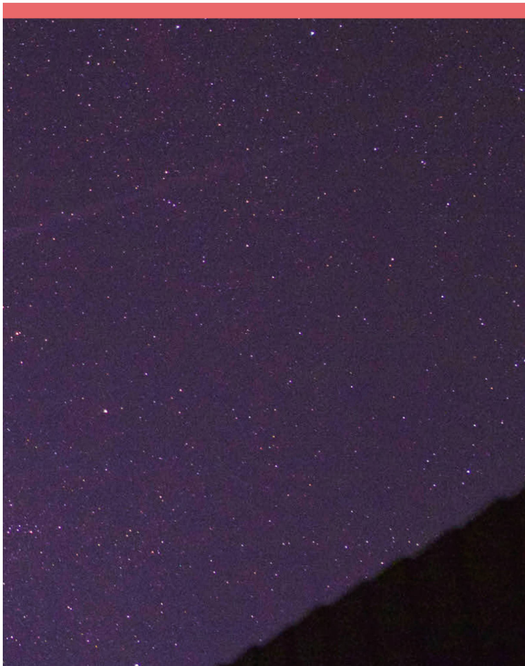
Abbildung 2: Ein heller Perseide hinterlässt am 12. August 2018 ein langes Nachleuchten.