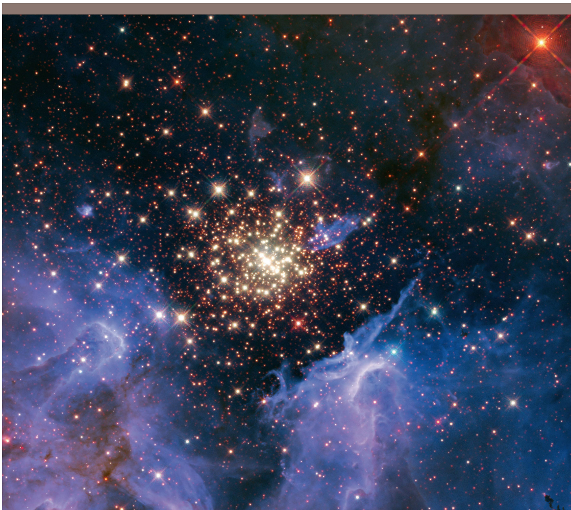
Abbildung 5: Hubble Aufnahme von NGC 3603, einer Region in unserer Milchstrasse, in welcher sich aus Gas- und Staubwolken eine grosse Zahl junger Sterne gebildet hat. Die Sterne im zentralen Haufen haben mit ihrer Strahlung ein enormes Loch in die Gaswolken gebrannt.

Aber auch die Dunkle Materie könnte durch eine heute noch nicht nachgewiesene Kraft erklärt werden.