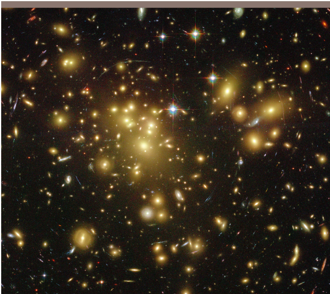
Abbildung 3: Galaxien im Coma-Haufen. Die Objekte mit einem «Strahlenkreuz» sind Vordergrundsterne aus unserer Milchstrasse. Alle anderen auch noch so kleinen Flecken sind Galaxien. Die Masse des Haufens ist so gross, dass das Bild einiger Galaxien wie durch eine Linse verzogen ist (Bogenlinien).

T.S. Eliot, Little Gidding , 1942 «Wir lassen niemals vom Entdecken, und am Ende allen Entdeckens, sind wir zurück am Anfang, und werden diesen Ort zum ersten Mal erkennen.»