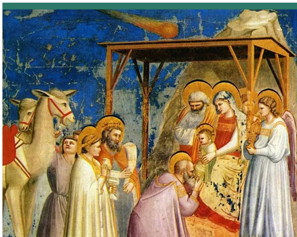
Abbildung 1: Anbetung der Heiligen Drei Könige, Cappella degli Scrovegni (Padua).

Viele Historiker haben sich mit dem «Weihnachtsstern» befasst, und dabei sind auch schon andere Himmelserscheinungen, die in jenen Zeitraum fallen, in Erwägung gezogen worden: Sogar der legendäre Hal-