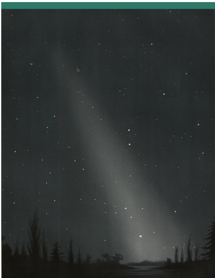
Abbildung 5: Zodiakallicht am Abendhimmel, nach einer Zeichnung von Étienne Léopold Trouvelot.