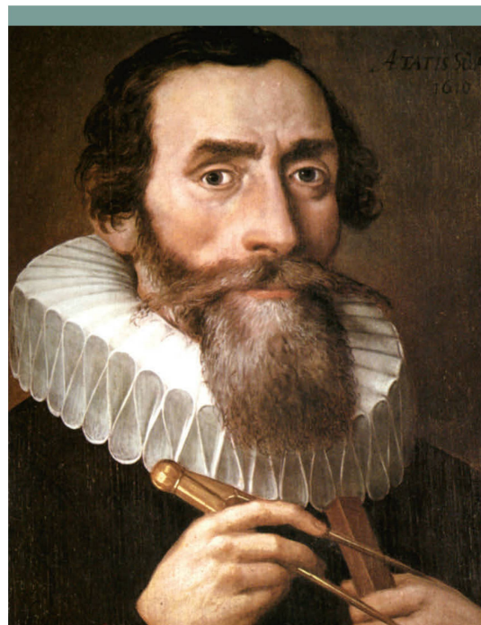
Abbildung 1: Johannes Kepler in einem Gemälde von 1610.

vor zwanzig Jahren mit Hilfe einer Computersimulation exakt datieren. Keplers rohe Zeichnung dokumentiert den Stand der drei Planeten über dem südöstlichen Horizont von Prag am Weihnachtsmorgen, d. h. am 25. Dezember 1603, kurz nach 06:30 Uhr Ortszeit! Nur diese eine scharfe Zeitmarke kommt für die Konstellation in Frage, denn der schnelle Lauf des Merkurs sorgte am Tag davor und am Tag danach für eine deutlich andere Lage des Dreiergestirns. Und