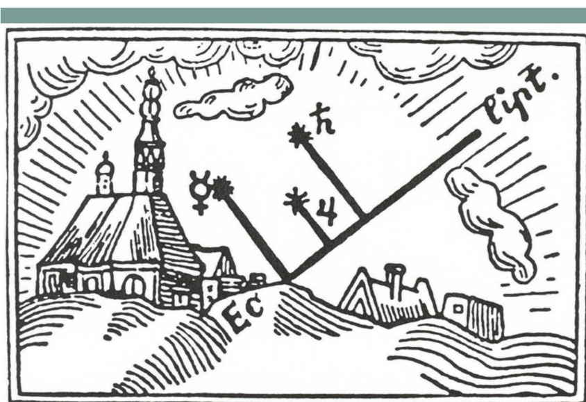
Abbildung 2: Keplers Holzschnitt mit den drei Planeten Merkur, Jupiter und Saturn über der scheinbaren Sonnenbahn (Ekliptik).