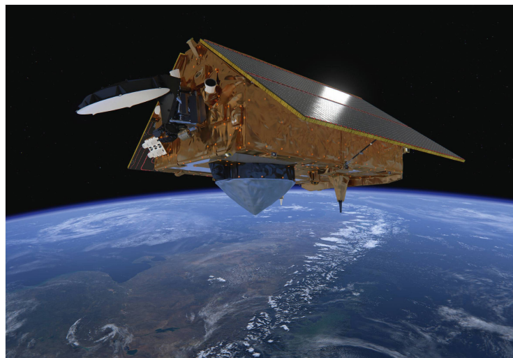
Abbildung 1: Copernicus Sentinel-6 über den Anden. Der Satellit übernimmt die Rolle der Radaraltimetrie-Referenzmission und setzt die Langzeitaufzeichnung von Messungen der Meeresoberflächenhöhe fort, um den Anstieg des Meeresspiegels zu überwachen und Wissenschaftlern zu helfen, den Eisverlust an den Polen, an Gletschern und am Meer besser zu verstehen.

Wie es in Zukunft aussieht, ist jedoch ungewiss. Denn die Schweiz ist nicht Mitglied von Copernicus. Ab 2022 werden Folgeaufträge für Satelliten und Komponenten nur noch an Copernicus-Mitglieder (EU-Länder oder assoziierte Staaten) vergeben. Auch eine Teilnahme an der Weiterentwicklung der Dienste sowie die Nutzung sämtlicher Daten ist nicht mehr garantiert.