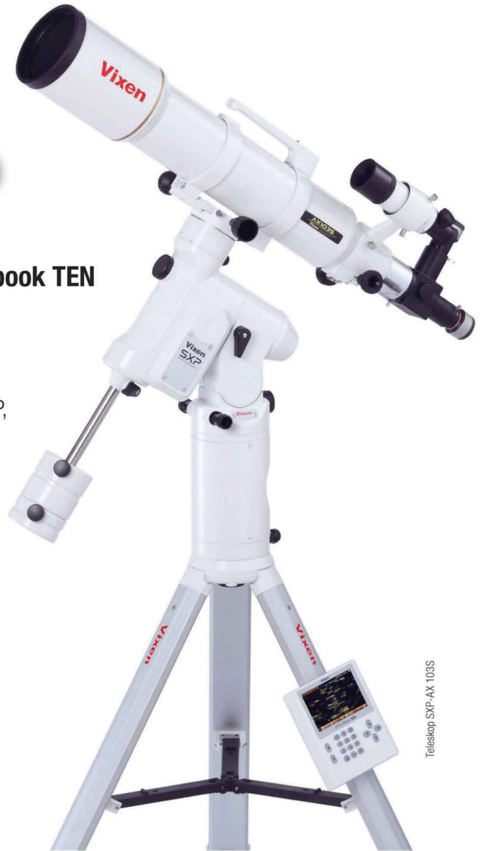
Teleskop SXP-AX 103S

VIXEN Fernrohr-Optiken: Achromatische Refraktoren – Apochromatische Refraktoren – Maksutov Cassegrain – Catadioptrische Systeme VISAC – Newton Reflektoren.