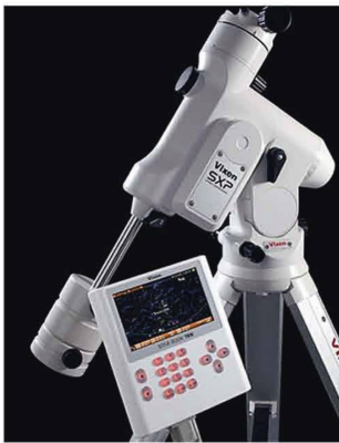
Parallaktische Montierung SXP mit Starbook TEN