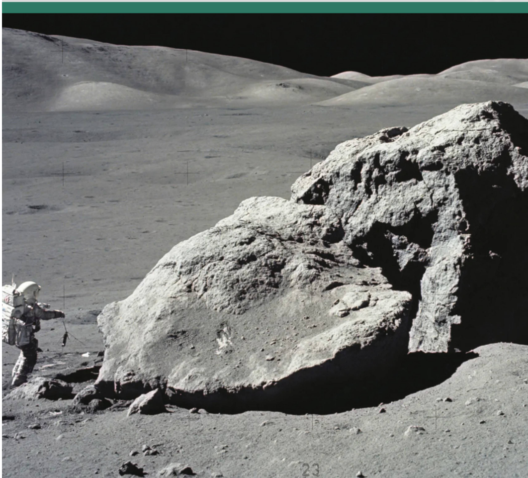
Abbildung 1: Der Apollo-17-Astronaut Harrison Schmitt sieht neben diesem grossen Mondbrocken winzig aus. Sein Astronaut-Kollege Gene Cernan hat dieses Foto von Schmitt , dem einzigen Wissenschaftler und Geologen, der den Mond besucht hatte, aufgenommen, während er sich wahrscheinlich darauf vorbereitete, Proben zu sammeln. Man achte auf die komplett schwarzen Schatten!

So oder ähnlich könnte wohl die Frage in einer Unterrichtsstunde endlos weitergehen. In der Tat ist Licht ein faszinierendes Phänomen, nicht bloss für Physiker. Wie so oft bei Dingen, die wir zwar wahrnehmen, aber doch nicht wirklich fassen können, haben wir es beim Licht mit einer äusserst komplexen Erscheinung zu