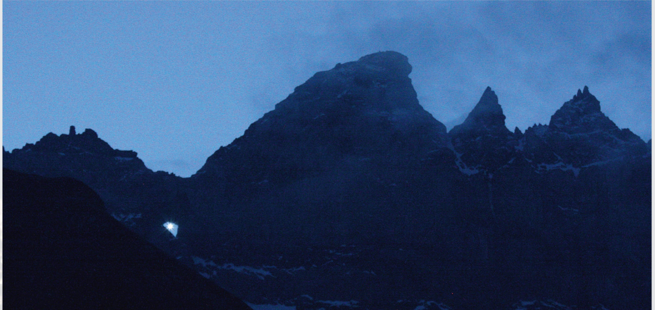
Abbildung 1: Für einmal guckt nicht die Sonne, sondern die Venus durch das Elmer Martinsloch.