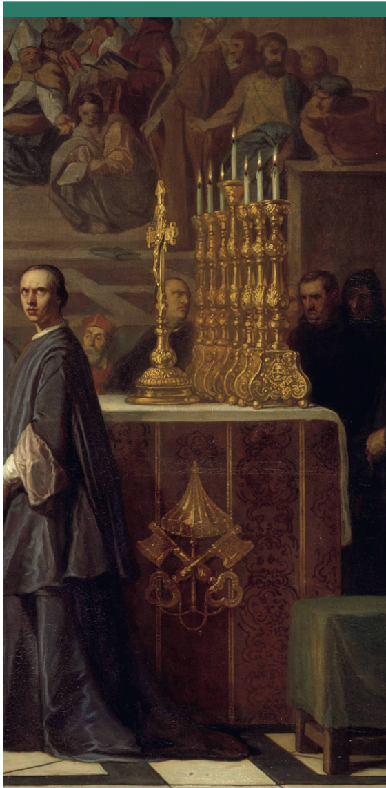
Abbildung 3: Galileo Galilei vor der Inquisition im Vatikan 1632 – Gemälde von Joseph Nicolas Robert-Fleury aus dem Jahr 1847.

Die Legendenbildung zeigt aber auch, wie stark dieser Prozess die Fantasie der Nachwelt angeregt hat; der Prozess von Galilei ist zu einem Symbol geworden für den Kampf zwischen Wissen und Glauben, zwischen der kritischen Wissenschaft und der dogmatischen Kirche. <