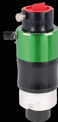
QUARK Magnesium CHF 1658.-