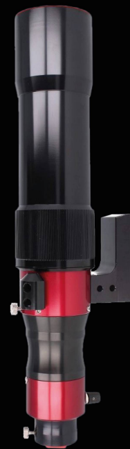
Solar Scout 60-DS ab CHF 1099.-

..weitere Daystar Produkte finden Sie bei uns im neuen Showroom & im Onlineshop