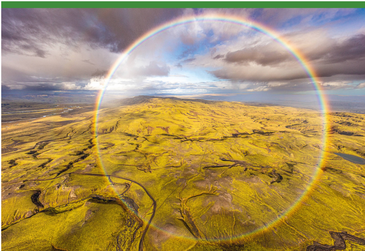
Abbildung 2: Kreisregenbogen. Dieses Bild gelang Peter Schwager vom Helikopter aus über dem Hochland von Island. Der äussere Rand des Regenbogenkreises hat 84^\circ Durchmesser. Des- sen Zentrum liegt nur 4^\circ unter dem mathematischen Horizont. Dieser kann mit Hilfe dieser Angaben im Bild gefunden werden. Kamera: Canon EOS 5DS R, EF 11-24 mm, f/4L USM. Foto: 11 mm, 1/1250 sec, f / 5.6, ISO 200.