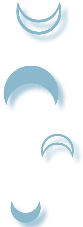
Abbildung 1: In dieser Grafik ist das Phänomen « obsigend » und « nidsigend » am Beispiel des Septembers 2022 aufgezeigt. Vom 1. bis 4. ist der Mond noch « nidsigend » (☾), ab dem 5. dann « obsigend » (☽). Der Wechsel zu « nidsigend » erfolgt wieder am 3. Oktober 2022.

Das Phänomen « obsigend » und « nidsigend » ist von der Beleuchtungsphase des Mondes völlig unabhängig. Betrachten wir dazu einmal die Situation im September 2022. Zu Monatsbeginn steht der Mond als grosse zunehmende Sichel in der Waage und kulminiert um 17:22 Uhr MESZ 26° 26' hoch genau im Süden. Tags darauf ist der fast halbe Mond im westlichen Bereich des Skorpions angekommen. Jetzt kulminiert er um 18:13 Uhr MESZ nur noch 21° 23' hoch; der Mond ist also während der ersten vier Tagen des Septembers noch « nidsigend », bevor er vom 5. bis zum 19. September täglich höher steigt, also « obsigend » wird und maximal 69° 28' erklimmt. Vom 20. September bis zum 2. Oktober sinkt er wieder ab (« nidsigend »), ehe das Spiel