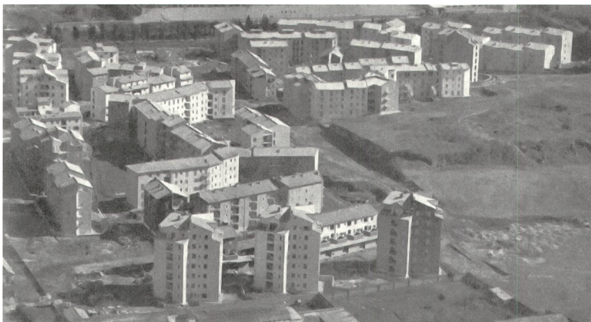
6 Quartiere Tiburtino, Rom, Luftbild