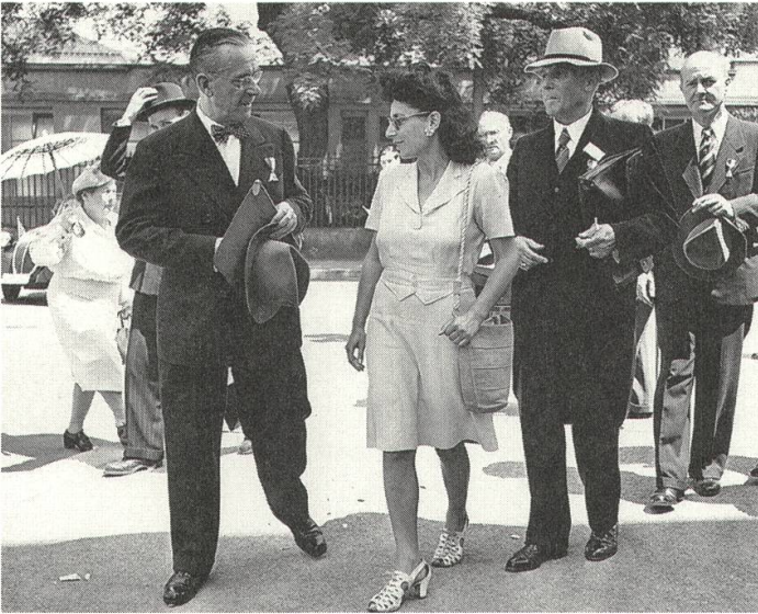
1 Thomas Mann auf dem Weg zur Eröffnung des internationalen PEN-Kongresses in Zürich, 3.6.1947