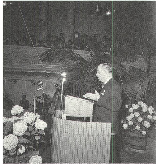
2 Thomas Mann hält die Festansprache zur Eröffnung des internationalen PEN-Kongresses, Tonhalle Zürich, 3.6.1947