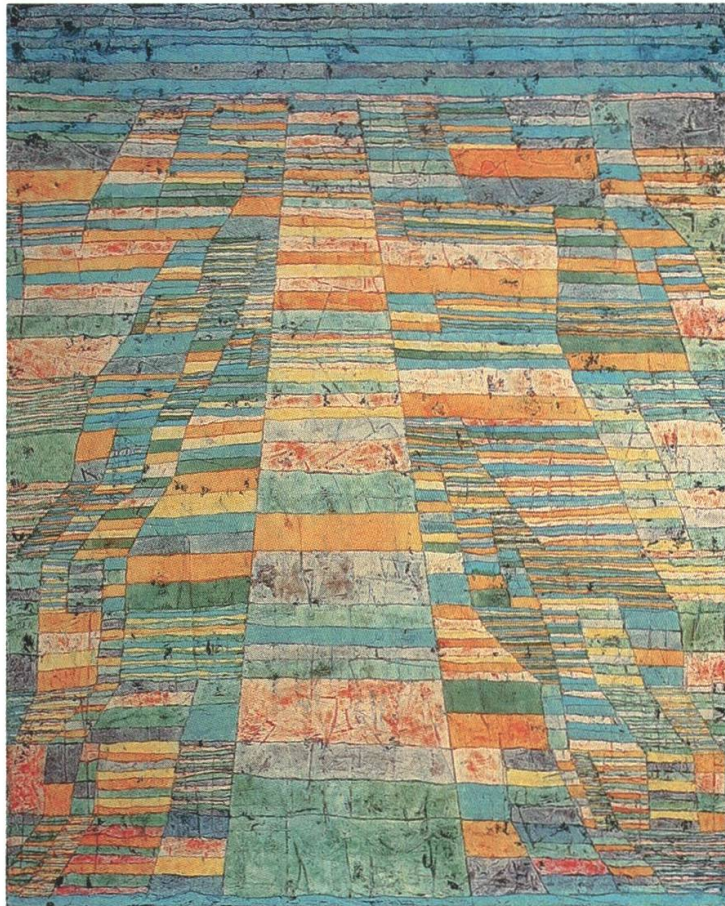
I Paul Klee (1879–1940), Hauptweg und Nebenwege , 1929, 90 (R 10), Ölfarbe auf Leinwand auf Keilrahmen, 83,7 x 67,5 cm, Museum Ludwig, Köln

eine raumzeitliche Bewegung. Auf diese Weise soll, wie Giedion-Welcker mit Hugo Ball formuliert, nicht unbedingt Kunst im ästhetischen Sinne, sondern das «inkorrupte Bild» hervorgebracht werden. 27 Klees Deutung der Kinderzeichnung signalisiert modellhaft die Abkehr von einer Gegenstandsbeschreibung und die Hinwendung zu einer Art kreativer Erforschung der Welt: «Ein Kind zeichnet und malt, wie es denkt. Seine Bilder – wenn sie rein und unverdorben bleiben – sind Bilder einer inneren Auseinandersetzung, eines inneren Fortschreitens im Durchdringen der Welt. Sie haben in ihrer Natürlichkeit ein eigenes Gesetz. Sie weisen auf ferne Zustände, innige, längst verlorene, die nur mühsam einzuholen sind.» 28