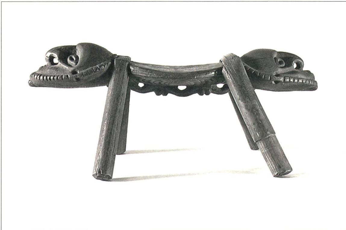
1 Kopfbank, Neu-Guinea, Sepik, 19./frühes 20. Jh., Holz, 12 x 33 cm, Museum Rietberg Zürich

Verkaufsausstellungen bezeichnet werden können. Die definitive Auflösung der Sammlung erfolgte 1954 durch eine Auktion beim Stuttgarter Kunstkabinett. 5 Gerne hätte sie ihre Sammlung integral einem Schweizer Museum vermacht gehabt, dies kam jedoch vor allem aufgrund der Verslossenheit gegenüber dieser Kunstgattung der Schweizer Museumswelt bzw. des Schweizer Kunstmarktes damals nicht zustande.