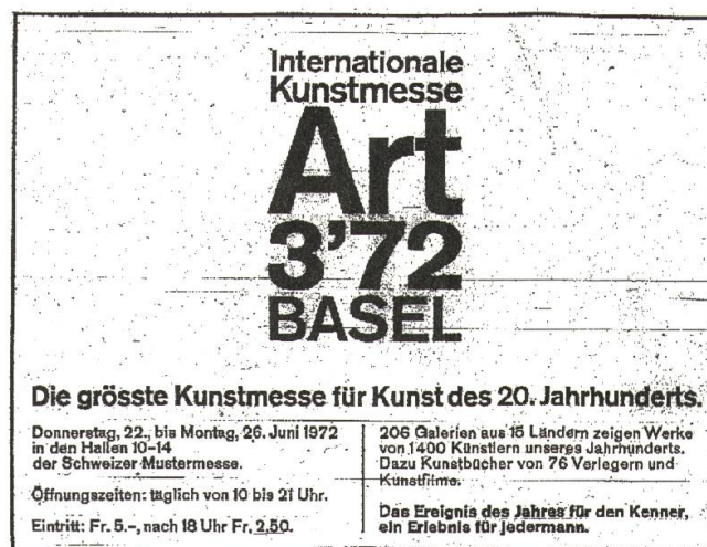
2 Die Anzeige für die dritte Art in der Neuen Zürcher Zeitung , 21. Juni 1972

1972 fand die Basler Kunstmesse zum ersten Mal im Rundhofgebäude der Schweizer Mustermesse statt – dort, wo sie noch heute durchgeführt wird. Die Veranstalter der dritten Basler Messe rühmten sich, mit über 200 Ausstellern «die grösste Kunstmesse für Kunst des 20. Jahrhunderts» zu sein (Abb. 2). 24 Die Kritiker waren sich einig, dass sich die Art im dritten Jahr als wichtigste Messe für Kunst des 20. Jahrhunderts etabliert hatte. Eduard Beaucamp schrieb in der «Frankfurter Allgemeinen Zeitung»: «Beim dritten Mal scheint die Basler Kunstmesse endgültig zur Institution geworden, die weltweit nicht ihresgleichen hat». 25 In dieser kurzen Zeit zwischen 1967 und 1972 schien sich die Kunstmesse als neue Form der Kunstvermittlung und -vermarktung durchgesetzt zu haben. Dieser Erfolg ist u. a. auch auf die hohe Beteiligung renommierter US-amerikanischer