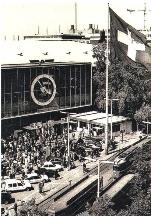
3 Der Messeplatz in Basel fünf Minuten vor der Vernissage der Art, 1991