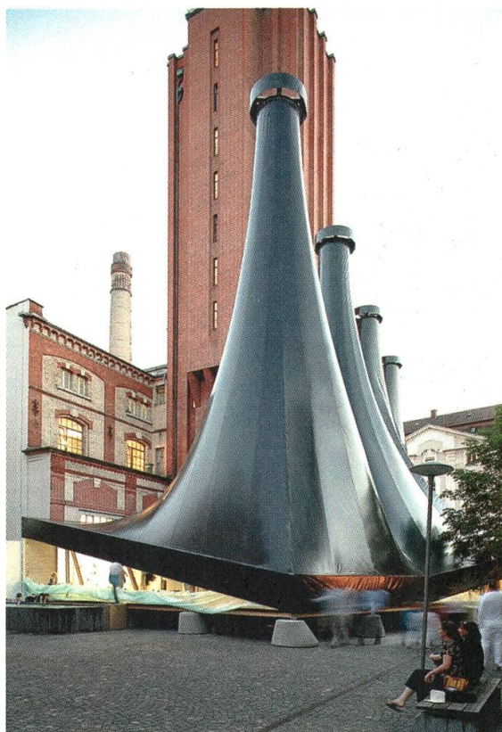
5 Der Standort der LISTE in Basel, 2008

Galerien zur Messe befand, ist bei der Art erst unter Lorenzo Rudolf ein strenges Auswahlverfahren eingeführt worden. Im Jahr 1992 ist die Art Cologne mit einer weiteren Nebenmesse, der Unfair, konfrontiert worden. Bereits zwei Jahre später ist die Protestmesse Unfair in die Art Cologne integriert worden. Dieser Zusammenschluss, diese «Mega-Messe» 47 provozierte 1996 die Gründung einer weiteren Kunstmesse in Berlin. 48 Das Art Forum Berlin wollte sich im Unterschied zur Art Cologne als kleine und qualitativ anspruchsvolle Kunstmesse positionieren. Dass in Basel erst in den Neunzigerjahren die erste Satellitenmesse zur Art gegründet worden ist, hängt auch mit dem ausgezeichneten Renommee der Basler Kunstmesse zusammen, wie Peter Bläuer, der Leiter der LISTE, in unserer Unterhaltung aufzeigt: «Die LISTE war tatsächlich fast ein Tabubruch. Das muss man sich unbedingt vergegenwärtigen. Die Art Basel war eine Art «heilige Kuh» in der Stadt. Alle liebten sie. Alle haben sich damit identifiziert. Als wir die LISTE gegründet haben, war die Empörung nicht klein. Unverständnis herrschte vor.» 49 Wenig Verständnis für die erste LISTE brachte auch die Leitung der Art Basel auf. So liess die Art-Direktion Wegweiser zur LISTE entfernen, die auf dem Messeplatz stationiert waren. Weiter wurde der LISTE untersagt, mit ihrem Shuttlebus auf dem