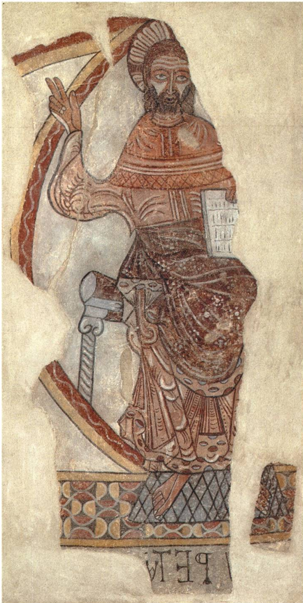
4 Christ en Majesté, fragment des fresques romanes de la chapelle de Casenoves, Roussillon. Restitué par le Musée d'art et d'histoire, Genève, à l'Etat français. Ille-sur-Têt, Musée des Hospices