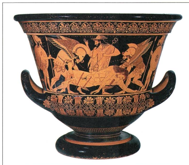
1 Euphronios et Euxithéos, Cratère d'Euphronios , environ 515 av. J.-Ch., cratère à figures rouges, H: 45,8; diamètre: 55,15 cm. Restitué à l'Etat italien

Pour pallier aux litiges éventuels que l'exécution de ces contrats peut susciter, l'ensemble de ces conventions prévoit un arbitrage CCI à Paris avec trois arbitres. Ici aussi la clause est intéressante: malgré l'absence de lien direct de ces accords avec le commerce international, les accords n'hésitent pourtant pas à faire appel à un centre spécialisé dans la résolution de litiges 18 .