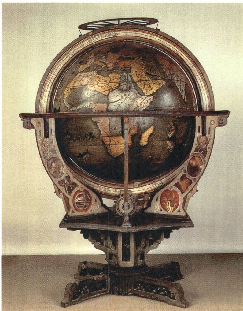
5 Globe terrestre et céleste de 1554. L'original est conservé au Musée national Zurich, la copie est déposée à la Stiftsbibliothek Saint-Gall