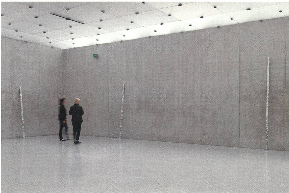
2 Roni Horn, White Dickinson , 2007, Installation, Aluminium und massiv gegossener Kunststoff, Ausstellungsansicht Kunsthaus Bregenz, 2010, Foto: Stefan Altenburger

Bevor ich auf die konkrete Arbeit eingehe, möchte ich an einen Artikel Horns in der isländischen Zeitung «Morgunbladid» aus dem Jahr 1997 erinnern. Darin appellierte die Künstlerin an die Isländer, diese sollten ihr Land als nördliches Kompensationsparadies, sozusagen wie ein naturistisches Fossil konservieren: «Es wird euer Selbstverständnis als Volk schwä-