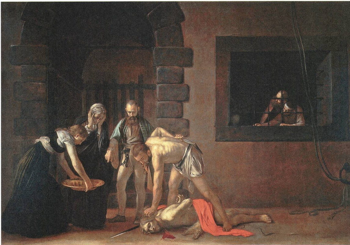
6 Michelangelo Merisi da Caravaggio, Enthauptung Johannes' des Täufers , 1607/1608, Öl auf Leinwand, 361 x 520 cm, Oratorio di San Giovanni Battista dei Cavalieri, La Valletta