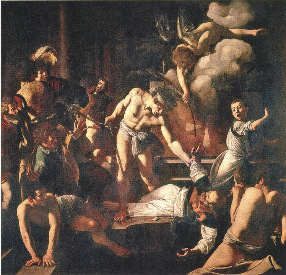
2 Michelangelo Merisi da Caravaggio, Martyrium des hl. Matthäus , 1599/1600, Öl auf Leinwand, 323 × 343 cm, S. Luigi dei Francesi, Cappella Contarelli, Rom

Diese kurze und keinesfalls vollständige Übersicht zeigt: Gewalt und Verbrechen sind eine reale Konstante im Kunstbetrieb und in Künstlerkarrieren. Doch bei keinem anderen Künstler hat die Nachwelt so sehr auf die Koinzidenz von krimineller Veranlagung und künstlerischem Schaffensprozess hingewiesen wie bei Caravaggio. Im Folgenden sollen einige Aspekte dieser unheilvollen Verbindung etwas eingehender betrachtet werden. Spiegelt sich in Caravaggios Bildern tatsächlich sein gewalttätiges Naturell (Abb. 2), wie dies von seinen Kritikern immer wieder behauptet wird, oder ist diese Kausalität nicht primär ein theoretisches Konstrukt? Lässt sich der Künstler ernsthaft auf die abschliessende Formel «Caravaggio assassino» reduzieren, wie dies eine Publikation aus den 1990er Jahren suggeriert? 11 Und wieso gilt nicht auch für ihn zunächst einmal die Unschuldsvermutung?