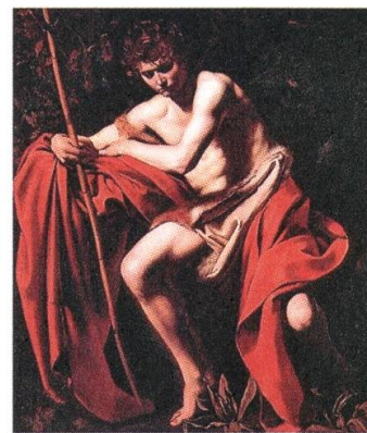
Saint John The Baptist in The Wilderness by Caravaggio

By Christopher Hudson Last updated at 4:22 PM on 28th June 2010