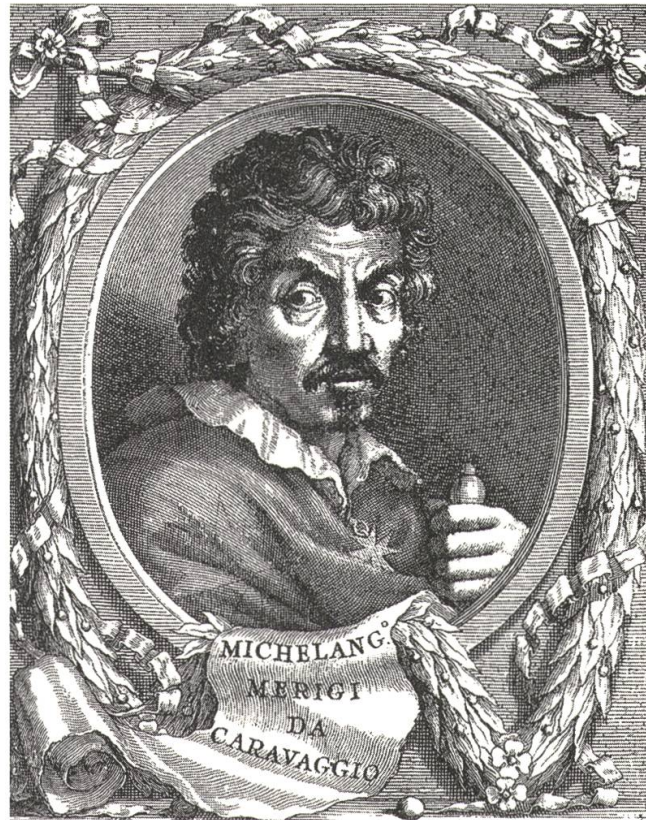
3 Die Hand stets griffbereit am Degen, Caravaggios Vignette in Belloris Viten , Rom 1672

Auch andere Biografen und Kunstkritiker wurden nicht müde, Caravaggios Kunst in den Dunstkreis des Aussenseitertums und des kriminellen Milieus zu rücken. Mit Vorliebe wird im 17. Jahrhundert berichtet, Caravaggio habe sich gelegentlich Prostituierten bedient, die er dann als Modelle für Madonnen- oder Heiligenfiguren verwendete. Einmal mehr setzt der wortgewandte Bellori solchen Legenden die Krone auf, indem er eine Anekdote schildert, die von den niederen Instinkten Caravaggios zeugen soll: Darauf angesprochen, weshalb er sich nicht die Antike oder die grossen Künstler wie Raffael zum Vorbild nehme, soll das «enfant terrible»