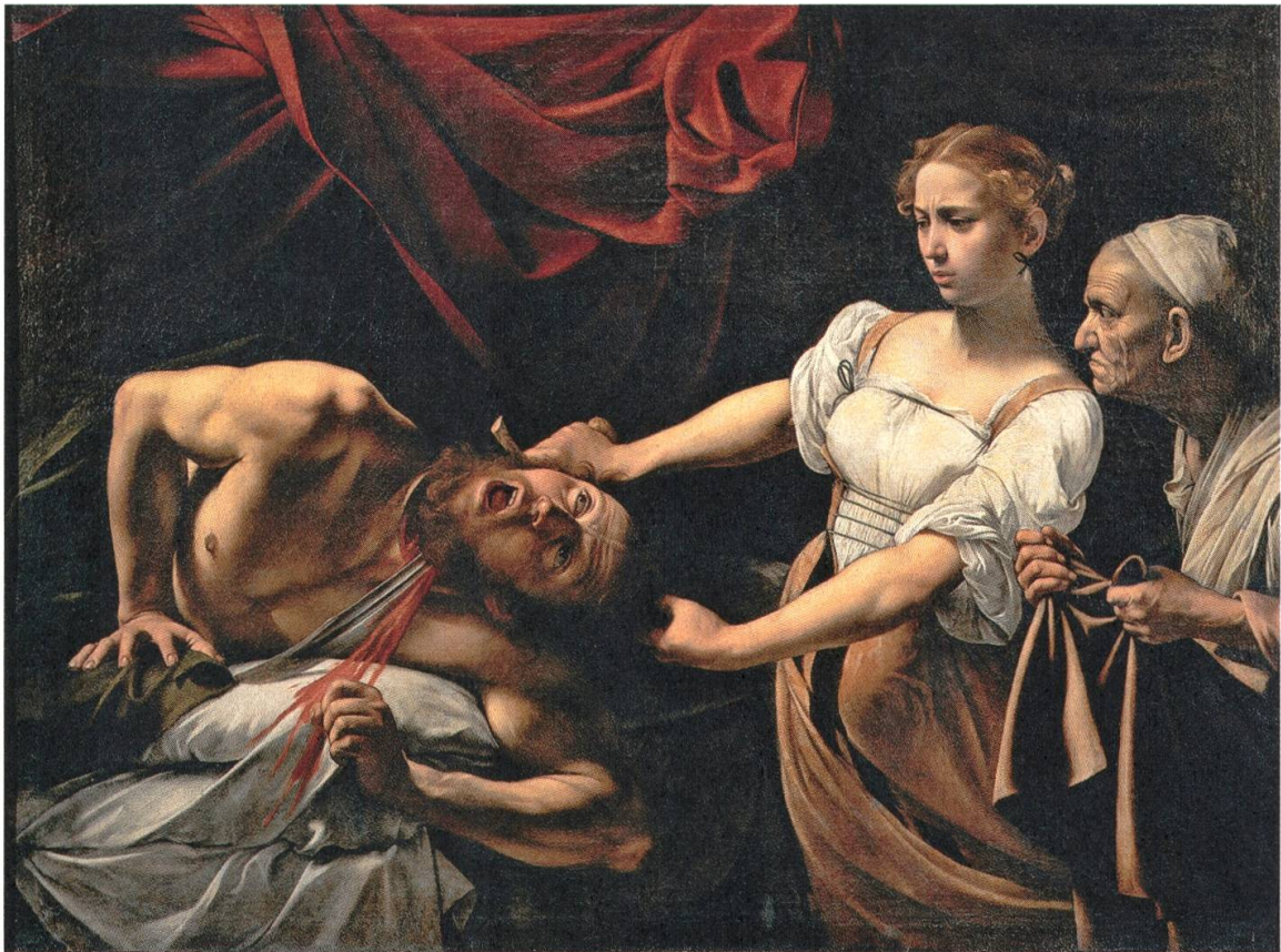
4 Michelangelo Merisi da Caravaggio, Judith und Holofernes , 1598/1599, Öl auf Leinwand, 145 x 195 cm, Galleria Nazionale d'Arte Antica, Palazzo Barberini, Rom

geantwortet haben, dass ihm die Natur genügend Modelle liefere. Und so habe er sich einer zufällig anwesenden Zigeunerin zugewandt, sie in sein Atelier mitgenommen und dort sogleich gemalt. Solche Geschichten sind offenbar darauf angelegt zu beweisen, dass Caravaggio nicht etwa durch künstlerische Überlegungen und Auswahl zu seinen Motiven fand – im Gegenteil, einzig der Zufall und seine Affinität für die Halbwelt bestimmten seine Malerei. Oder anders formuliert: Diese Kunst ist nichts anderes als das Produkt einer spontanen Laune. Sie entsteht schnell und verlangt offenbar auch nicht viel Vorbereitung. 25