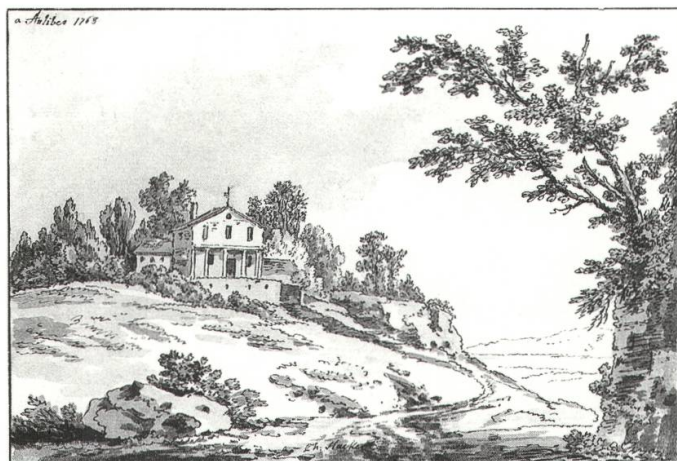
Abb. 1 Jakob Philipp Hackert, Landschaft bei Antibes , 1768, Feder und Pinsel in Schwarz und Grau, 13,5 × 20 cm, Klassik Stiftung Weimar, Graphische Sammlungen