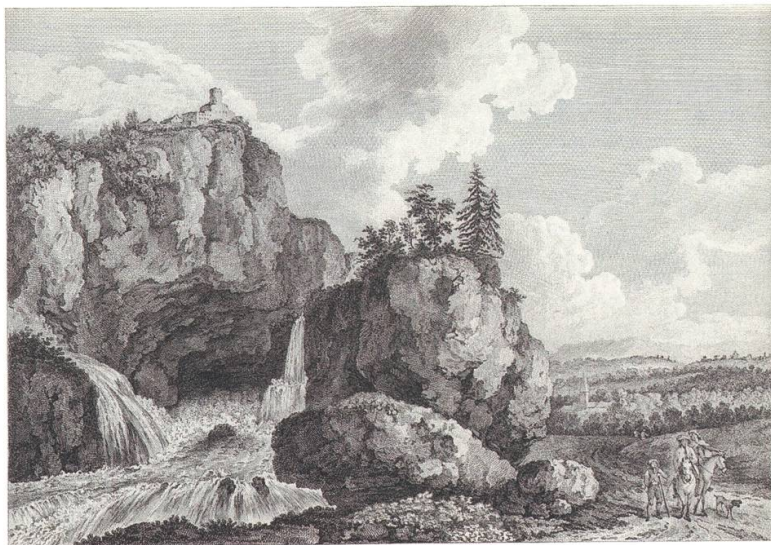
Abb. 2 Jérôme Paris nach Jakob Philipp Hackert, La Fontaine de Vaucluse , Kupferstich, 19 × 25 cm, Musée Pétrarque, Fontaine- de-Vaucluse, Inv.-Nr. 68

Aus den Werken und dem Brief Hackerts geht hervor, wie eng die Wahrnehmung der Provence noch mit der Italiens verknüpft war und dass ihre eigenständige Identität von ihm noch nicht erkannt wurde. Die Provence bezog ihren Reiz aus den landschaftlichen Szenerien und architektonischen «Kuriositäten», aber vor allem waren es sowohl die Spuren der römischen Antike, die von Künstlern gesucht wurden, als auch die literarische Vergangenheit der Gegend. Aber die Provence stellt für Hackert das erste «physische» Zusammentreffen mit der römischen Antike und der südlichen Natur dar, ein Faktum, das bislang wenig Beachtung fand. Desgleichen wurde der kulturelle und künstlerische Kontext, in dem Hackert sich in Paris weiterentwickelte, ebenso wenig untersucht wie die Schlüsselrolle, die Paris als wichtige Vorbereitungsphase für seine Reise in den Süden Frankreichs und nach Italien zukam. Während Hackert den Rest seiner Karriere in Italien zubrachte, entwickelte sich in Paris in den folgenden Jahrzehnten eine neue Landschaftsauffassung, die einen weitreichenden Einfluss haben sollte.