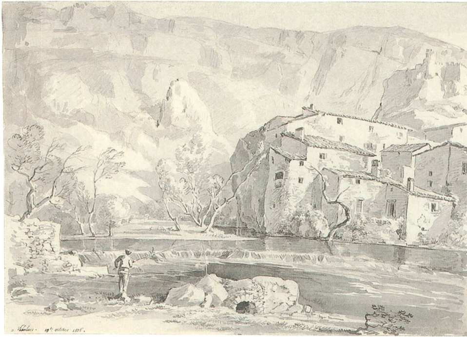
Abb. 4 Johann Georg von Dillis, Voyage pittoresque dans le Midi de la France: Vaucluse , 1806, Pinsel in Grau über Bleistift, Masse unbekannt, Staatliche Graphische Sammlung, München, Inv.-Nr. 21561

und auf einem der Blätter hielt er die Praxis des kulturellen Reisens fest, mit Staffagefiguren, die die Quelle der Sorgue bewundern. Wie aus dem Brief von Dillis hervorgeht, diente die Literatur und Poesie immer noch als Vermittlerin, um sich der südlichen Natur anzunähern. Aber auch die bildliche Tradition des 18. Jahrhunderts stellt eine Referenz für die deutschen Künstler dar. So erweckten die Mittelmeerküste Frankreichs und die Hafenstädte die Assoziation mit Claude-Joseph Vernet. Dillis schrieb von Marseille aus an seinen Bruder folgende Zeilen: «Ich habe in Niza viele Zeichnungen gemacht, und wenn wir noch lang so an der Küste herumziehen, so werde ich noch vollends ein Seemaler: [...] Meine Eitelkeit geht sogar dahin den Ruf eines Vernet zu erreichen.» 35