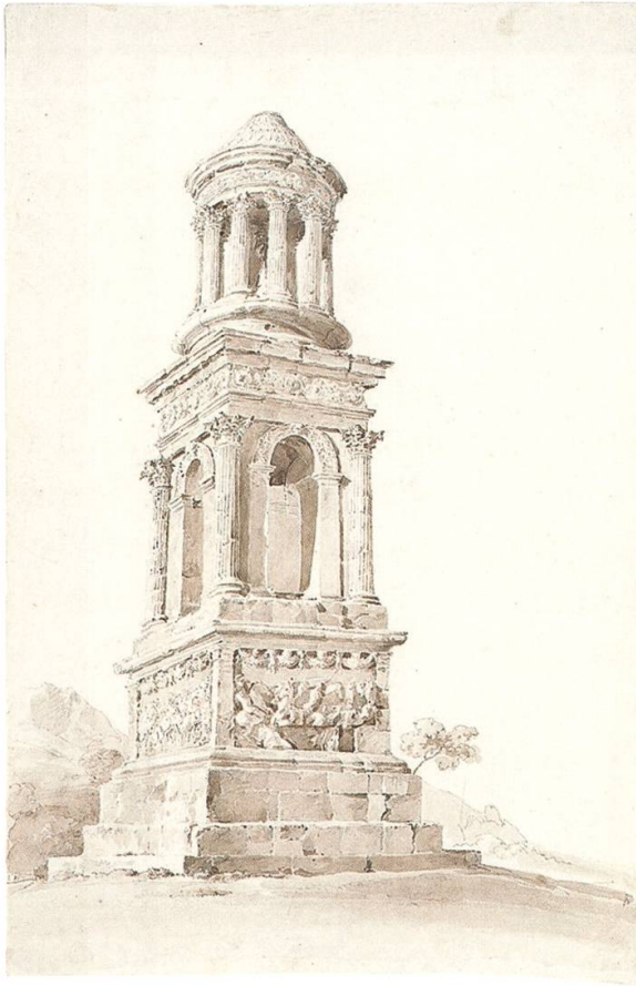
Abb. 3 Johann Georg von Dillis, Voyage pittoresque dans le Midi de la France: Saint-Rémy-de-Provence , 1806, Pinsel in Braun über Bleistift, Masse unbekannt, Staatliche Graphische Sammlung, München, Inv.-Nr. 21573