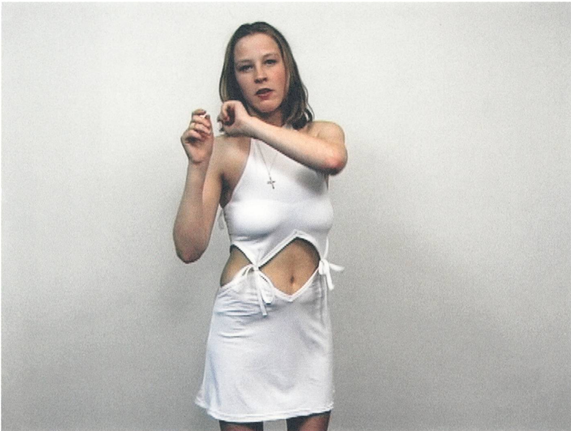
Abb. 1 Rineke Dijkstra, The Buzzclub, Liverpool, UK / Mysteryworld, Zaandam, NL , 1996–1997, synchronisierte 2-Kanal-Videoinstallation, ca. 26', Farbe, Ton (Videostandbild)

fotografien eher kühl und distanziert anmuten, wirkt die Videoprojektion in ihrer amateurhaften Qualität sowie durch die laute, schnelle und rhythmische Musik belebend und involvierend.