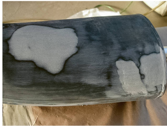
Abb. 4 Roman Signer, Stiefelbrunnen , 2004, Detail des Stiefels in teilrepariertem Zustand, Foto: Anabel von Schönburg