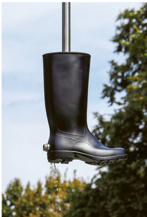
Abb. 2 Roman Signer, Stiefelbrunnen , 2004, Detail des Stiefels