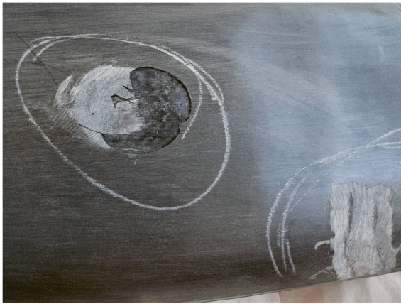
Abb. 3 Roman Signer, Stiefelbrunnen , 2004, Detail des Stiefels mit Beschädigungen, Foto: Anabel von Schönburg