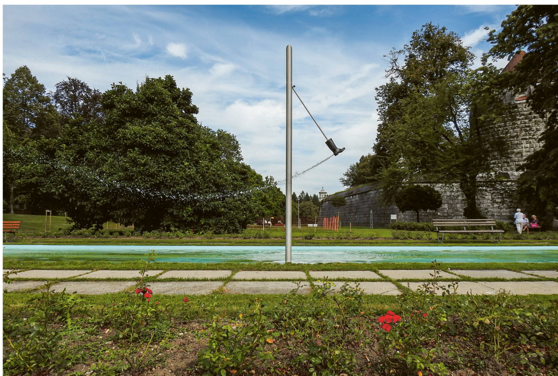
Abb. 1 Roman Signer, Stiefelbrunnen , 2004, Stiefel: carbonfaserverstärktes Epoxidharz, Stangen: Edelstahl, 435 × 300 × 40 cm, Museumspark Kunstmuseum Solothurn, Foto: Anabel von Schönburg