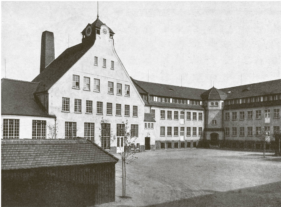
Abb. 3 Richard Riemerschmid, Neubau der Deutschen Werkstätten für Handwerkskunst in Hellerau, 1909/1910, östlicher Werkstättentrakt (rechts) mit Maschinenhaus (links)

Werkbund auch Innenansichten zeigte, bei denen man durchaus von einer «Veredelung» des Arbeitsplatzes zugunsten der Arbeiterinnen und Arbeiter sprechen konnte, 26 interessierte nicht, allein die äussere Erscheinung und der Stil der Architektur standen im Vordergrund. Der Werkbund musste die Kritik einstecken, plante aber schon bald eine Neuauflage des Projekts.