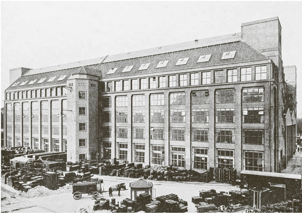
Abb. 4 Peter Behrens, Hochspannungsfabrik der AEG am Humboldthain in Berlin-Wedding, 1909/1910, Ansicht von Süden

dessen Anfänge als Architekt und Theoretiker sich zum damaligen Zeitpunkt nahtlos in die Entwicklungen beim Werkbund integrieren sollten. Die Verbindung aus Geniekult, romantischem Glauben an die Kunst, idealistischem Sendungsbewusstsein und der Anrufung des Geistes als Essenz der Form bzw. der Form als Verkörperung des Geistes fand im neuen Werkbundziel der «Durchgeistigung» einen äusserst passenden Ort. Gropius wurde schliesslich auch die Neukonzipierung der Industriebauten-Ausstellung übertragen, die unter seiner Ägide nun genau das vorweisen konnte, was 1909 noch vermisst worden war: einen einheitlichen modernen Stil, eine ahistorische Gestaltung fürs Maschinenzeitalter mit künstlerischem Anspruch. Zwar musste Gropius aus vereinsinternen Gründen auch konservativere Entwürfe mit aufnehmen, seine persönliche Linie wurde dennoch sehr deutlich. Peter Behrens (Abb. 4), Hans Poelzig und der amerikanische Ingenieurbau waren für ihn Ausdrucksträger einer neuen Form. 36 Ganz im Sinne der Maschinenästhetik sollten die Bauten schmucklos und gleichförmig sein, mit exakt geprägten Formen, die sich auf einen – selbst flüchtigen – Blick erfassen liessen.