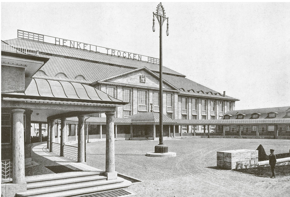
Abb. 2 Paul Bonatz, Neubau der Sektkellerei Henkell & Co. in Biebrich bei Wiesbaden, 1907–1909, Hauptfassade und Ehrenhof mit Kolonnadenumgang, Fotografie von unbekannt

Hauptpunkte der Kritik trafen den Werkbund hart, schliesslich wurde ihm genau das vorgeworfen, was er bekämpfen wollte: Stilpluralismus, Verwendung zu vieler Ornamente und Anleihen bei der Vergangenheit. Dass der