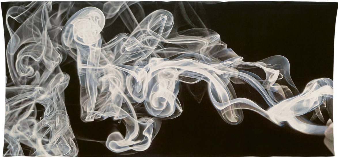
Abb. 9 Pae White, Smoke knows , 2009, Baumwolle und Polyester, 287 × 624,8 cm, San Francisco Museum of Modern Art

einen Unterschied macht. Unabhängig davon, ob die Ausführung handwerklich oder industriell erfolgt, wird die Umsetzung als primär technisches Verfahren gewertet, das von der Künstlerin oder vom Künstler angeleitet wird. Gewandelt hat sich auch der gesamte Entstehungsprozess: Schon die Vorlagen beruhen nicht mehr auf eigenhändigen Entwürfen, sondern entstehen aus collagierten Fotografien und Scans, die analog oder digital zusammengeführt und bearbeitet werden. Die Herkunft aus den vorangegangenen Übersetzungsprozessen bleibt dabei in den textilen Endergebnissen, die ihre medialen Vorlagen auch zur Schau stellen, sichtbar.