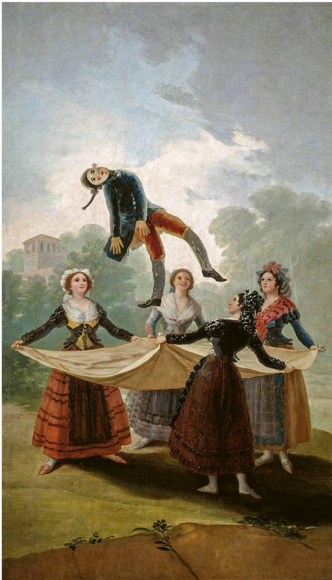
Abb. 1 Francisco de Goya, El Pelele (Die Strohuppe) , 1791–1792, Öl auf Leinwand, 267 × 160 cm, Museo Nacional del Prado, Madrid Karton aus der Serie der sieben Werke für den Despacho del Rey (Arbeitszimmer des Königs) im Escorial