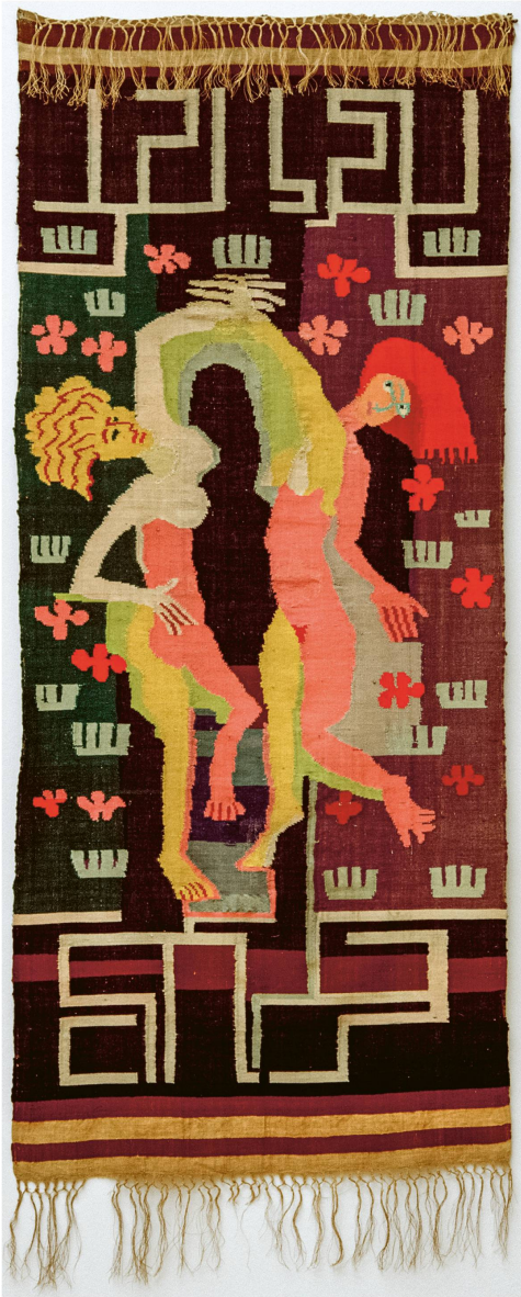
Abb. 3 Ernst Ludwig Kirchner, Zwei Tänzerinnen , 1924, verzahnte Wirkerei mit Leinenkette und farbigem Wollschuss, 192 × 82 cm, Umsetzung: Lise Gujer, Sammlung Eberhard W. Kornfeld, Bern/Davos

für Dufy eigens ein Atelier, La petite usine, ein und stellte ihm einen Chemiker für die Farb- und Drucktechnik zur Seite. Dufy zeichnete, fertigte die Holzschnitte an, bestimmte die Farben, druckte selbst oder leitete die Umsetzung an.