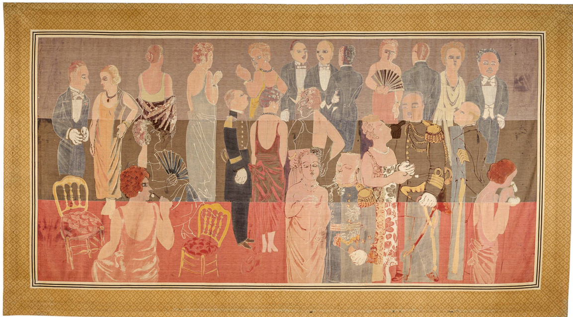
Abb. 4 Raoul Dufy, La Réception à l'Amirauté (Der Empfang bei der Admiralität), 1924, Leinwand, bedruckt mit «couleurs rongeantes», 263 × 477 cm, Umsetzung: Bianchini-Férier, Tournon (Ardèche), Centre Pompidou, Paris

für Stoffe zu liefern, bei deren Gestaltung er aber vollkommen frei war. Grund für den Wechsel dürften die grösseren technischen Möglichkeiten gewesen sein, die Dufy eine Weiterentwicklung seiner textilen Experimente ermöglichten. Der Kontakt zu Paul Poiret blieb aber weiterhin bestehen. 1925 beauftragte er Dufy mit der Ausstattung eines der drei Hausboote, die Poiret anlässlich der Exposition Internationale des Arts Décoratifs et Industriels Modernes in Paris an den Ufern der Seine einrichten wollte. Für das Tanzboot entwarf Dufy 14 Wandbehänge, die mit der technischen Hilfe von Bianchini-Férier ausgeführt wurden. Motive der monumentalen Textilbilder waren Szenen aus dem Alltag des mondänen Paris, die nach gemeinsamen Grundprinzipien gestaltet waren. Die Bildgründe wurden jeweils in drei horizontal aufeinandergesetzte farbige Bänder gegliedert, über die sich gewissermassen das Ornament der Gesellschaft ausbreitete (Abb. 4). Ausgeführt wurden die Werke als bedruckte Leinwände, wobei Dufy ein besonderes Verfahren, die «couleurs rongeantes» (ätzende Farben), 34 anwandte, bei dem die Farben eine chemische Verbindung mit dem Stoff eingehen. Das spezielle Druckverfahren dürfte neben der Grösse der Wandbehänge mit ein Grund dafür sein, warum er sie als «tapis», als Teppiche, bezeichnete. 35 Die für klassische Bildteppiche üblichen Bordüren unterstreichen diese Zuordnung.