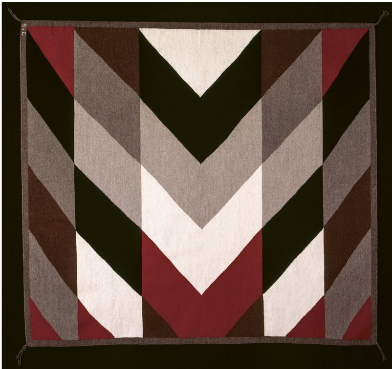
Abb. 6 Kenneth Noland, Line of Spirit , 1993, Wolle, 157,2 × 151,8 cm, Gloria F. Ross Tapestry, Umsetzung: Sadie Curtis, Kinlichee, Arizona, Navajo Nation, The Art Institute Chicago, Gift of Mr. and Mrs. Clyde E. Shorey, Jr.

nuancen zu verändern, wenn sie dies für stimmiger hielten. Er selbst adaptierte Muster und Farben der Navajo-Kultur in seinen Entwürfen.