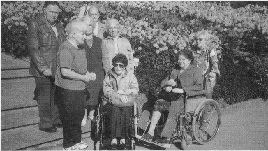
Die Dahlienschau auf der Insel ist eine Pracht bei diesem Sonnenschein.