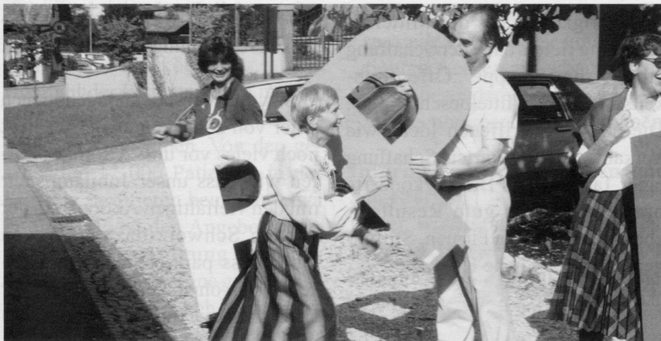
P wie Parkinson: Weiterbildungstagung 1994 in Wislikofen

Infirmis eine schriftliche Vereinbarung für die Beratung von Patienten getroffen, die 1994 durch einen neuen Vertrag ersetzt wurde. Die Vereinigung ist auch Mitglied der Schweizerischen Gesundheitsligenkonferenz GELIKO, der Schweizerischen Arbeitsgemeinschaft für die Eingliederung Behinderter SAEB, der Schweizerischen Arbeitsgemeinschaft Hilfsmittelberatung SAHB, der Schweizerischen Arbeitsgemein-