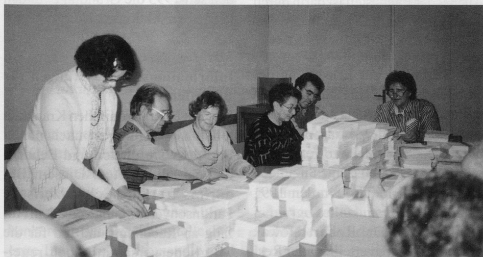
Die Zürcher-Gruppe beim Verpacken des Mitteilungsblattes