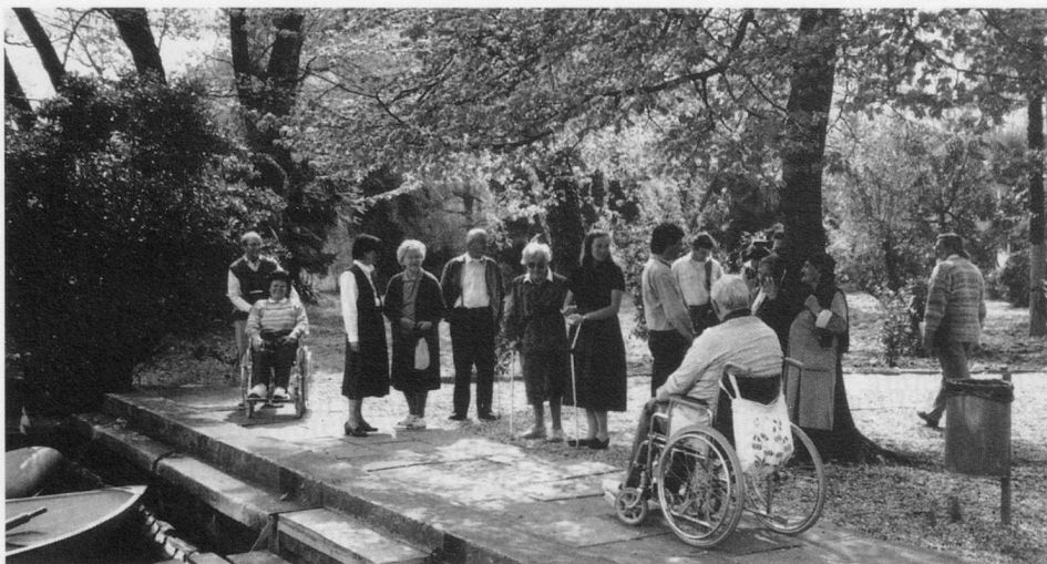
Ferienlager in Magliaso

schaft für Rehabilitation SAR sowie der Zentralauskunftsstelle für Wohlfahrtsunternehmungen ZEWÖ. Sie versucht zudem immer wieder, mit anderen sozialen Institutionen gemeinsame Aktionen zu planen oder Dienstleistungen gemeinsam zu nutzen (z.B. Ferienangebote zusammen mit der Rheumaliga, MS-Gesellschaft usw.).