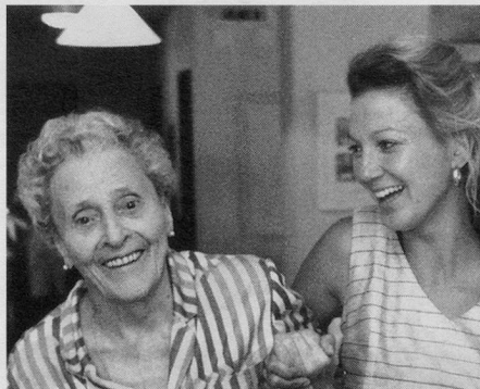
Seite 7 / Page 13 / Pagina 19