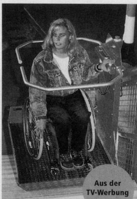
Aus der TV-Werbung