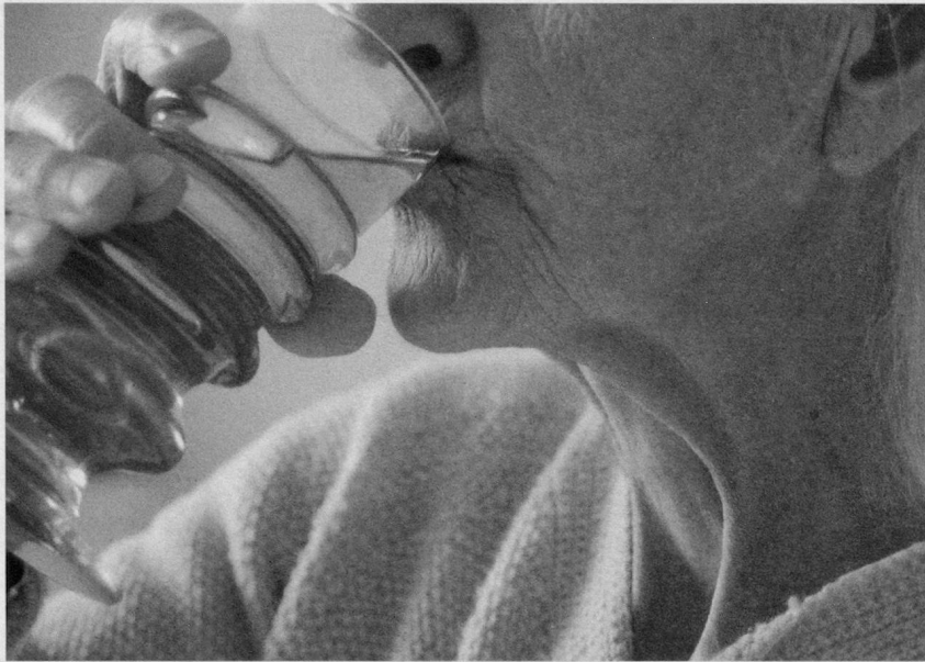
Getrennt essen und trinken beugt Verschlucken vor

bung meist spät bemerkt – ebenso wie Schluckstörungen. Warnende Anzeichen bei drohender Austrocknung sind eine herabgesetzte Hautspannung, konstanter Gewichtsverlust, trockener Mund oder ein rascher, schwacher Puls. Auf Schluckstörungen weisen neben Atemschwierigkeiten eine heisere, rauhe Stimme, Essensverweigerung oder wiederkehrende Fieberschübe hin. «Diese Anzeichen muss man immer ernst nehmen», so Absil.