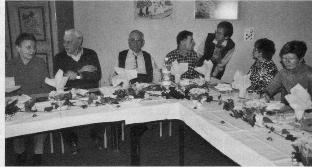
Fröhliches Fest zum Geburtstag der Glarner Gruppe