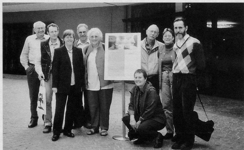
Die Schweizer Delegation im Südtirol.