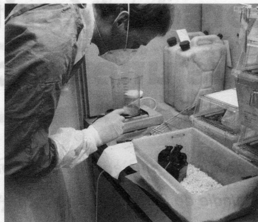
La science ne ferait pas de progrès si elle ne pouvait pas faire de tests sur les animaux (ici à l'EPF de Zurich).

ont retrouvé dans de grandes parties du striatum des neurones positifs à la TH qui - par contre - avaient totalement disparus chez les animaux témoins. Comparativement aux études faites jusqu'à ce jour, dix à cent fois plus de cellules ont pu à nouveau être amenées à produire de la TH et donc de la dopamine. Les chercheurs pensent que ce succès est dû au nouveau vecteur qui est plus efficace.