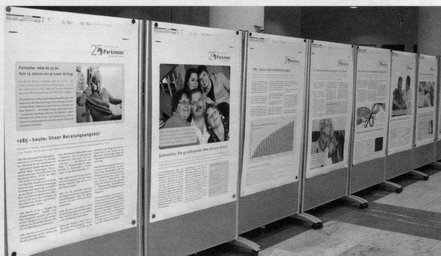
Parkinson Schweiz beteiligte sich mit einer grossen Posterausstellung zum Thema «25 Jahre Parkinson Schweiz» sowie mit Referaten und einer Podiumsdiskussion an der Parkinsonwoche 2010.