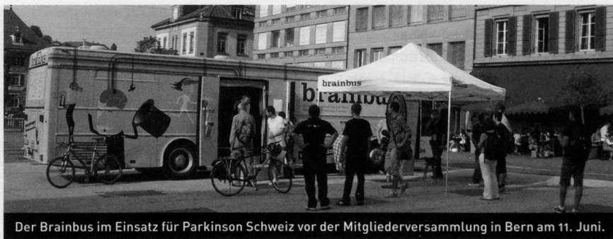
Der Brainbus im Einsatz für Parkinson Schweiz vor der Mitgliederversammlung in Bern am 11. Juni. jro

V erblüfft, begeistert, beeindruckt. Diese drei Worte beschreiben die Empfindungen der Besucher der multimedialen Ausstellung, die im Brainbus darauf wartet, entdeckt zu werden, wohl am besten. Seit Beginn seiner Schweiz-Rundreise am 17. April in Liestal besuchen bereits mehrere Tausend Besucher den Brainbus, der mit Filmen, Modellen und spielerischen Versuchen die Funktion und die faszinierenden Fähigkeiten des menschlichen Gehirns vor Augen führt. Wie sehen wir ein Bild an? Wie gut ist unser Geruchssinn? Wie funktioniert unser Denken und warum lässt sich unser Gehirn von optischen Täuschungen hinter Licht führen? Im Brainbus erhalten die Besucher Antworten.