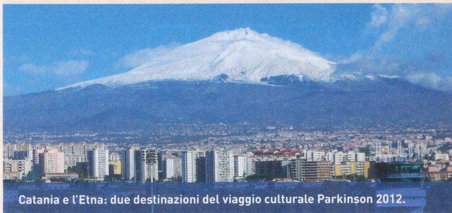
Catania e l'Etna: due destinazioni del viaggio culturale Parkinson 2012.