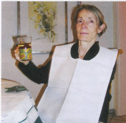
Rita Ryffels Servietten: Praktischer und umfassender Schutz.

Ab CHF 30.- pro Stück, zzgl. CHF 4.- Versandkosten, Rita Ryffel, Stettbachstr. 40, 8600 Dübendorf, Tel. 044 822 17 90, E-Mail: r.ryffel@glattnet.ch