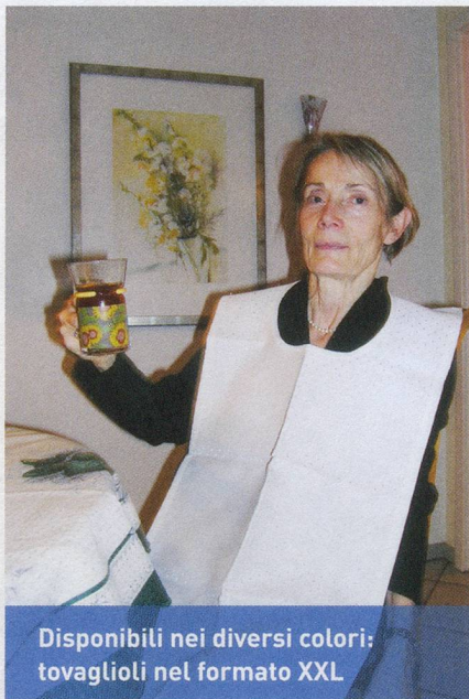
Disponibili nei diversi colori: tovaglioli nel formato XXL

Da CHF 30.- al pezzo, più CHF 4.- per le spese di spedizione; Rita Ryffel, Stettbachstr. 40, 8600 Dübendorf, tel. 044 822 17 90, e-mail: r.ryffel@glattnet.ch