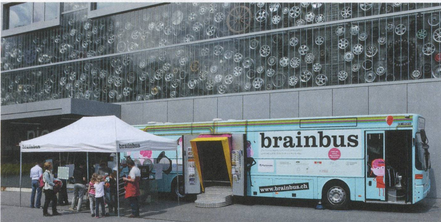
Anlässlich der 27. Mitgliederversammlung machte der BrainBus, die rollende Ausstellung über das menschliche Gehirn, direkt vor dem Verkehrshaus Station.