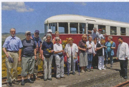
Antica: la ferrovia circumetnea.