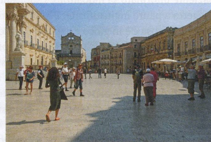
Cultura allo stato puro: Siracusa.